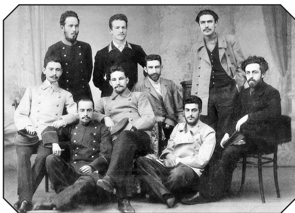
Студенты в форме

щей, у ст рьёвщиков н Сух ревке или у Ильинских ворот 1 . У Ильинских ворот есть д же две л вки специ льно студенческих ст рых костюмов. Тут не приходится р ссужд ть, приятно или неприятно носить пл тье неизвестно с чьего плеч , — быть может, больного или умершего от з р зной болезни.