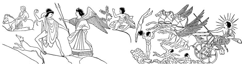
Эос и (или) Гелиос

землю, заливая все серебристым сиянием. Объехав небесный свод, богиня Луна спустится в глубокий грот горы Латма в Карию. Там лежит погруженный в вечную дремоту прекрасный Эндимион 1 . Любит его Селена. Она склоняется над ним, ласкает его и шепчет ему слова любви. Но не слышит ее погруженный в дремоту Эндимион, потому так печальна Селена и печален свет, который льет она на землю.