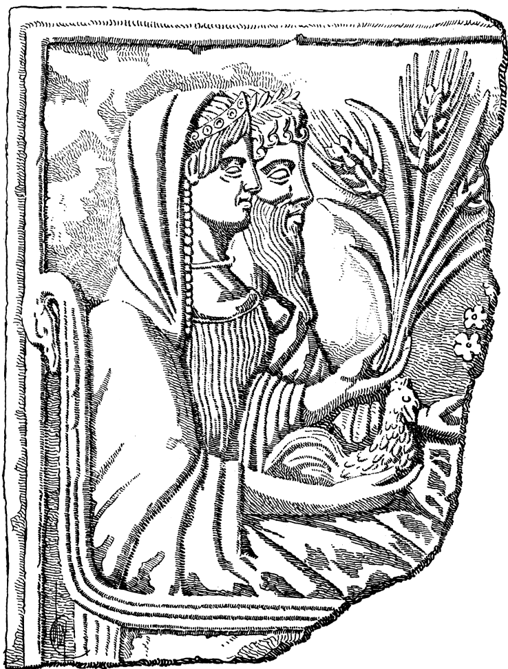
Царство Аида (Аид и Персефона)

рого движутся с грозным шипением змеи, сторожит выход. Суровый старый Харон, перевозчик душ умерших, не повезет через мрачные воды Ахеронта ни одну душу обратно, туда, где светит ярко солнце жизни.