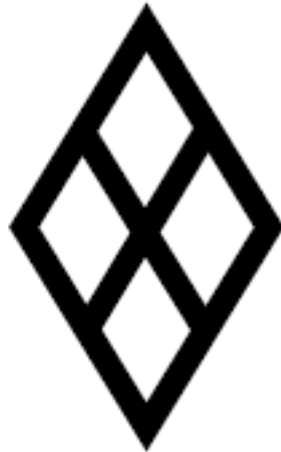
Рис. 3. Поле.

К древнейшим символам относятся и символы плодородия и символы растительного мира, прежде всего Мирового Древа.