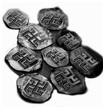
Рис. 7. Найденная археологами монета с изображением Марички.

Знак Маричка работает для тех, кто не грешит, относится к близким с любовью и помогает им. Помимо медитаций для эффективной работы знака вы можете совершить что-то полезное для людей. Необязательно для этого становиться героем, можно просто помочь старой соседке или родителям, завершить уборку дома и не мусорить на улице. Малые дела в большом количестве и регулярная медитация усиливают действие заряженного знака в десятки раз.