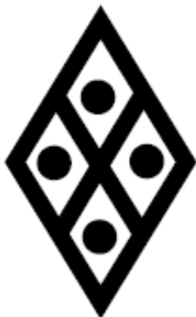
Рис. 4. Засеянное поле.