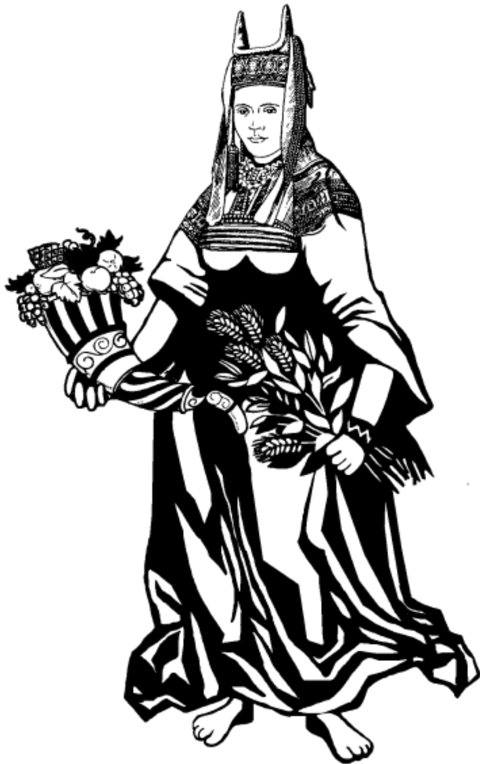
Рис. 2. Богиня Макошь.

Всего древнеславянских, или, можно сказать, ведических символов, в основе которых лежит свастика, более 144. Не все они пригодны для процесса взаимодействия человека с энергетическими полями земли, информация о некоторых безвозвратно утеряна, иные требуют долгой предварительной подготовки и доступны только посвященным, но даже к тем