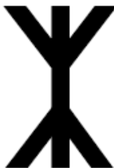
Рис. 6. Символическое обозначение мирового древа.

Существуют также символы магических птиц и животных, символы воды, огня, воздуха, женского и мужского начал и их союза.