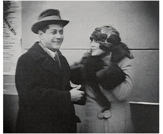
Кадры советского кинофильма с участием Капабланки