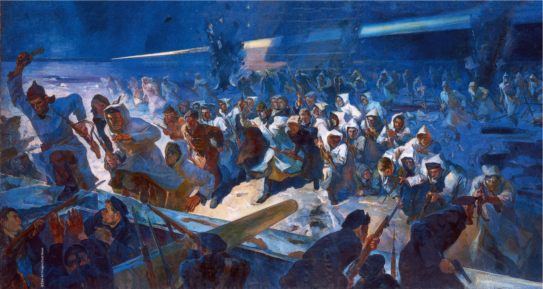
Красная армия штурмует Кронштадт по еще прочному льду

Кронштадтом можно овладеть только до оттепели. Как только станет свободным для плавания, установится связь Кронштадта с границей. В то же время остров станет недоступным для нас.