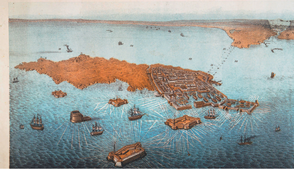
Положение Кронштадта относительно Петрограда

(СЪ ВДИМОСТЬ ОТДЕЛЕНИЯ) НА УСТЬЕ НЕВЫ И С ПЕТЕРБУРГА.