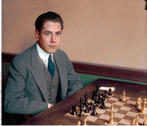
Первый общепризнанный гений шахмат