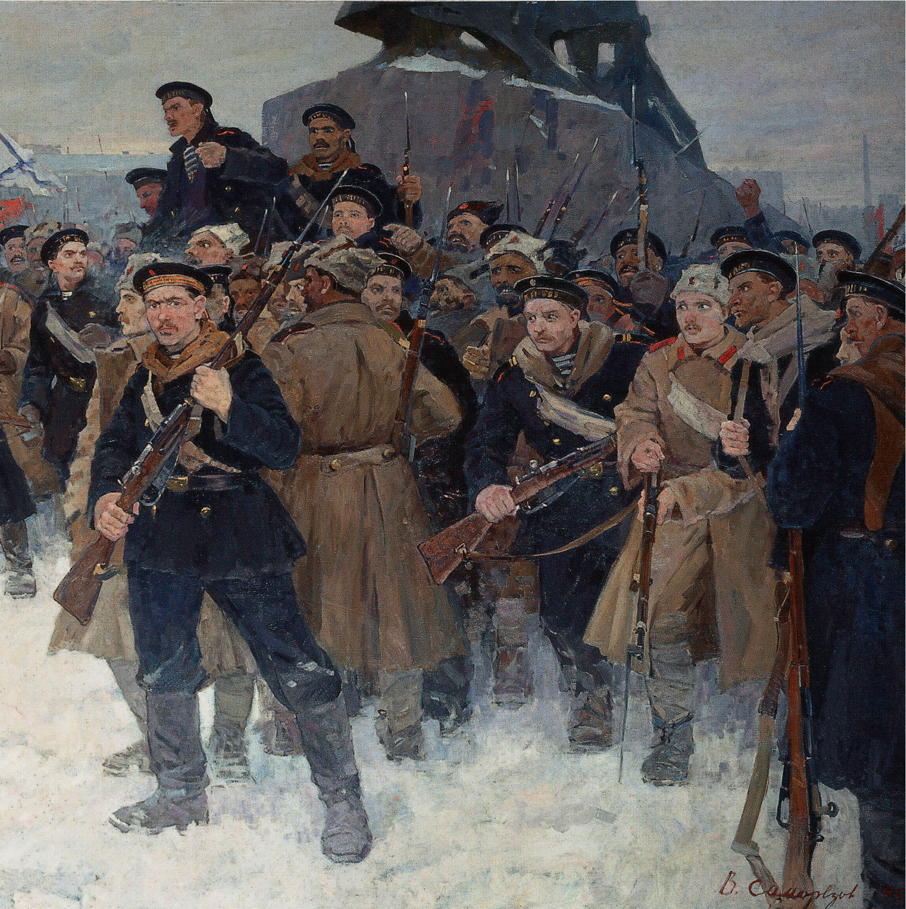
До восстания моряки считались самой революционной частью вооруженных сил