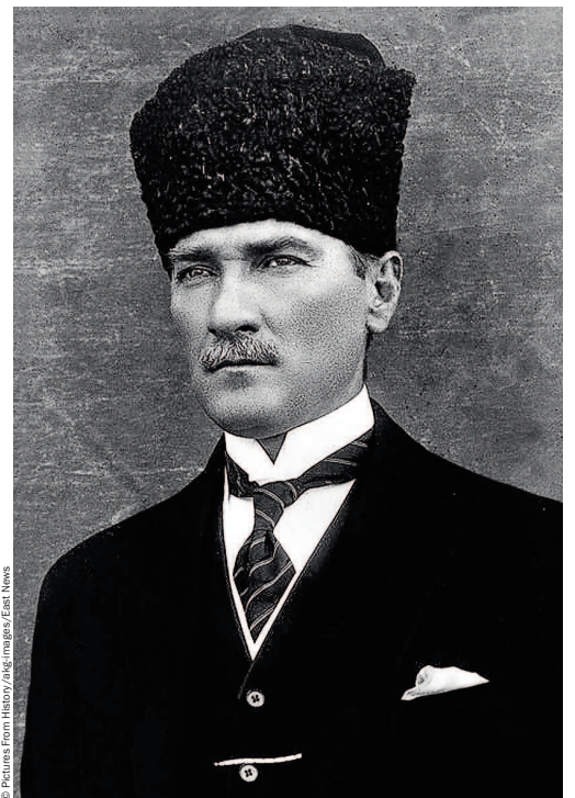
Мустафа Кемаль Ататюрк, первый светский правитель Турции

После смерти Ататюрка Турция во Второй мировой войне колебалась между Гер-