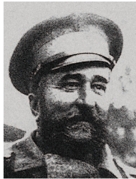
Генерал Александр Козловский

ший артиллерию Кронштадта, не занимал должностей в ревкоме и только позже будет привлечен ВРК к обороне крепости. Но его удобно выдать за предводителя повстанцев: тогда «мятеж» выглядит продолжением Гражданской войны с белыми. Козловский объявлен вне закона, в Петрограде взяты в заложники его семья, родные и друзья – всего 27 человек. Город и губерния переведены на осадное положение. Петроградский правитель Зиновьев объясняет выступление бли-