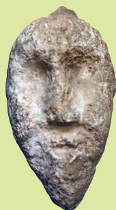
Каменное изваяние человеческой головы. Ранний бронзовый век