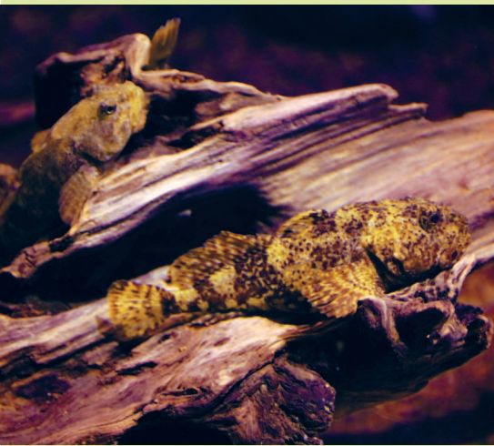
Байкальский бычок-подкаменщик, или широколобка