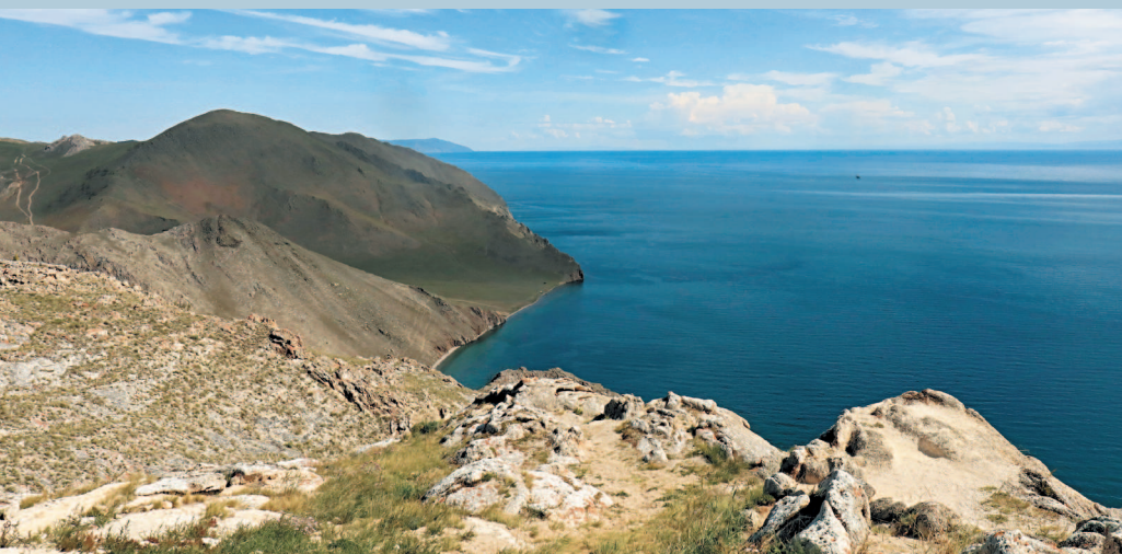
Западное побережье Байкала с высоты мыса Танхан

Зимний Байкал — завораживающее зрелище. Прозрачный, как стекло, лед метровой толщины нередко образует торосы высотой до 3 м. Цветовая палитра льдин варьирует от совершенно бесцветных и прозрачных, как стекло, до зеленоватых или голубоватых, почти синих. Незабываемое впечатление производят сокуи — причудливые ледяные наплески высотой до 15—20 м, образующиеся на прибрежных скалах после сильных штормов перед ледоставом.