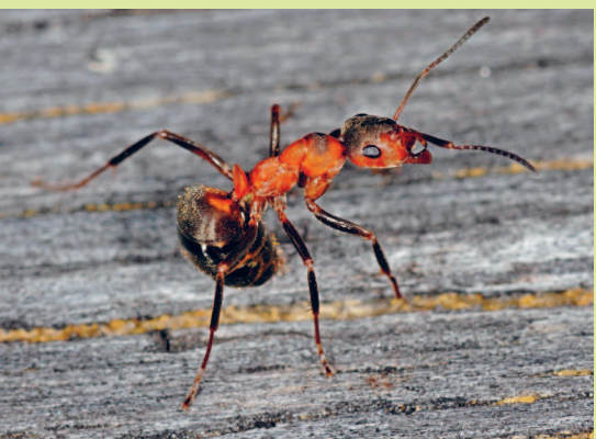
Рыжий лесной муравей в оборонительной позе