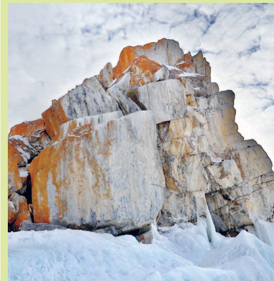
Западная оконечность священного мыса Бурхан на Ольхоне образована глыбами мрамора

Флора и фауна подводного мира озера насчитывает более 3,5 тыс. видов