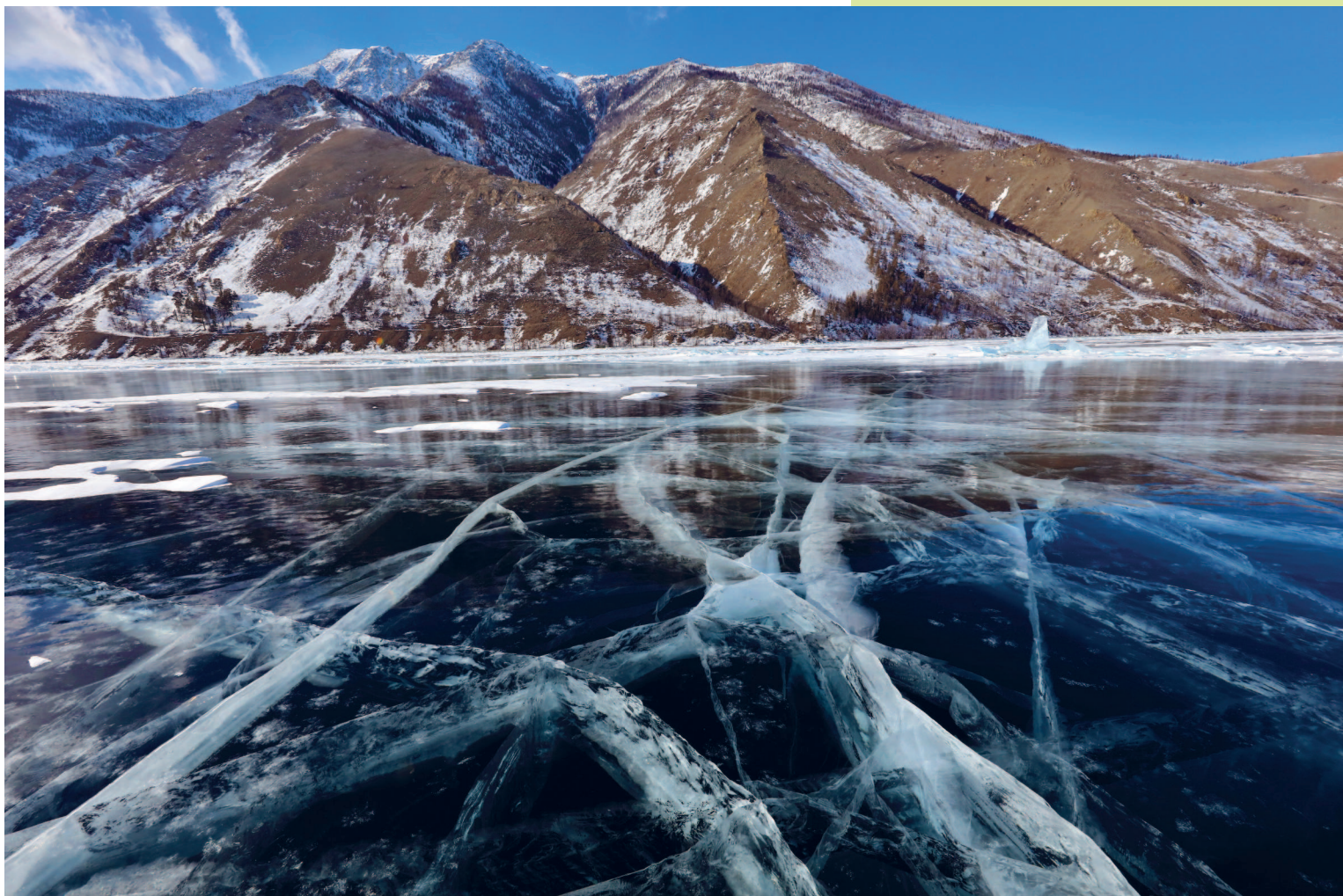
Байкальский лед. Байкало-Ленский заповедник