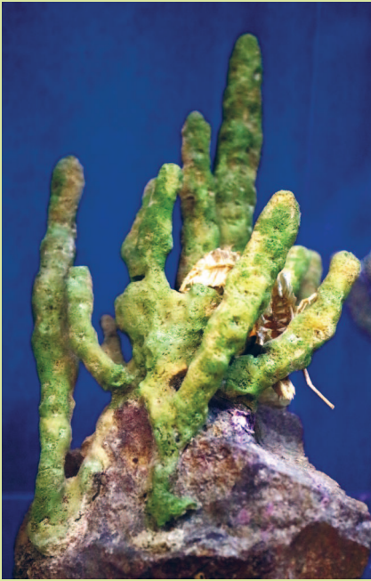
Байкальская губка любомирския байкальская