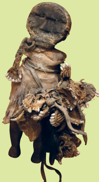
Эвенкийский дух предка семьи — онгон. XIX в.