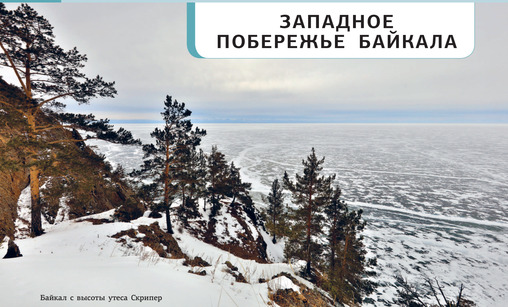
Байкал с высоты утеса Скрипер