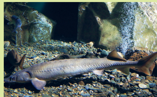
Байкальский осетр, подвид сибирского осетра (Красная книга России)

скими видами рода любомирския, обитают на глубине от 5 до 40 м. Благодаря порам, которыми пронизана вся поверхность губок, они пропускают через себя воду, фильтруя ее и очищая, причем за 20 секунд они способны пропустить через себя объем воды, равный объему тела. Губки — одни из главных живых фильтраторов байкальской воды.