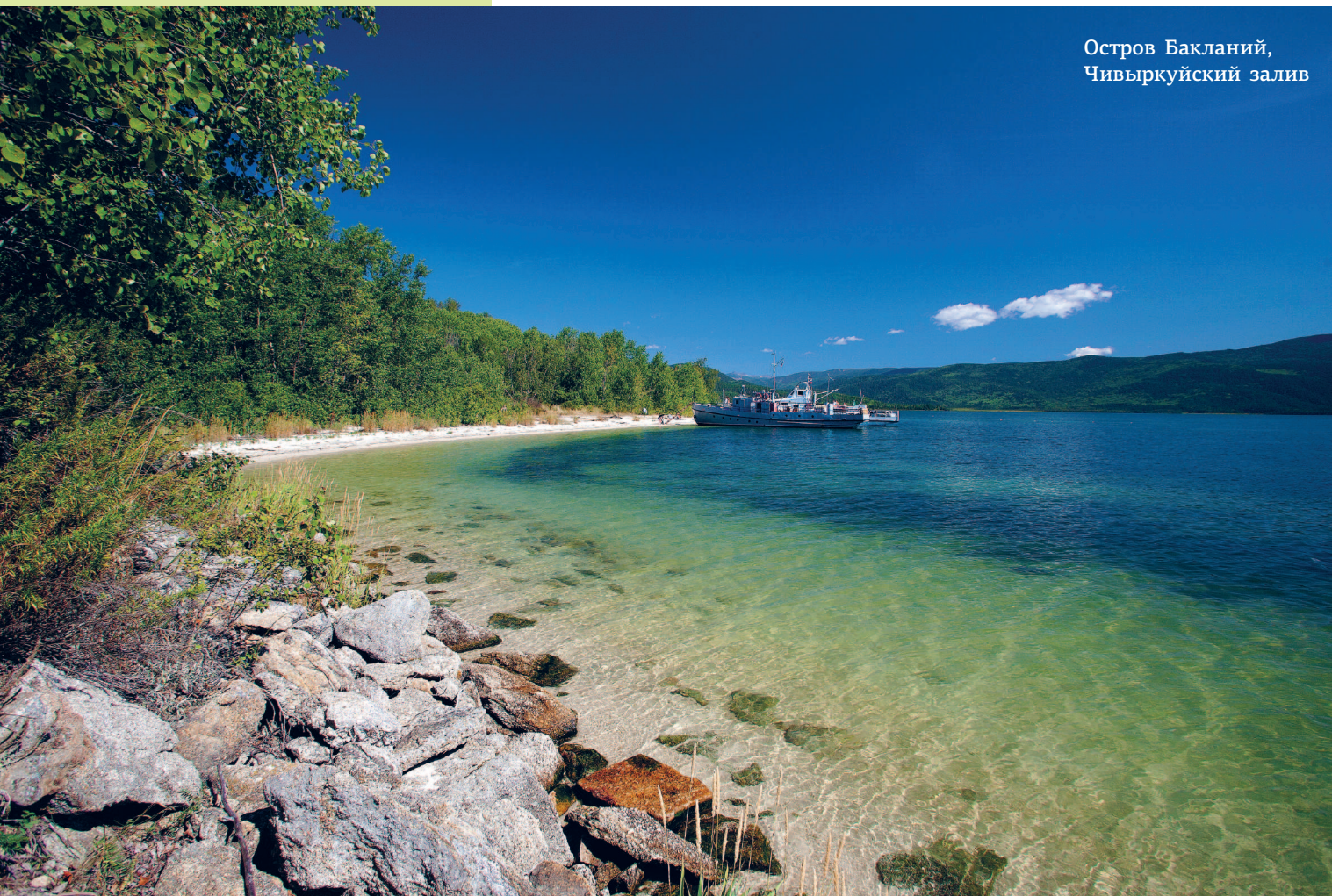
Остров Бакланий, Чивыркуйский залив

В Приольхонье (Тажеранская степь и побережье Малого моря) и на западном побережье о. Ольхон распространены массивы реликтовых степей, остатки сухих степей монгольского типа, когда-то в далеком прошлом широко распространенных в Сибири. Степные сообщества Ольхона и Приольхонья — уникальные природные образования, и именно здесь произрастает самое большое на побережье Байкала количество редких, реликтовых и эндемичных растений, многие из которых включены в Красную книгу России и Красную книгу Иркутской области.