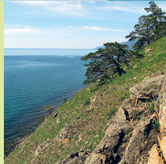
Крутые берега Приморского хребта

На территории парка известно около 1000 различных археологических памятников: стоянок древнего человека, древних языческих святилищ, городищ, крепостей, могильников. В течение многих веков памятники археологии гармонично вписывались в живописные ландшафты прибрежной части Байкала и придали им особое своеобразие, стали их неотъемлемой частью. Наиболее многочисленны археологические памятники на о. Ольхон и материковой части Приольхонья. В южной части парка, между пос. Порт-Байкал и Култук, проходит Кругобайкальская железная дорога, являющаяся уникальным памятником инженерного искусства начала XX в.