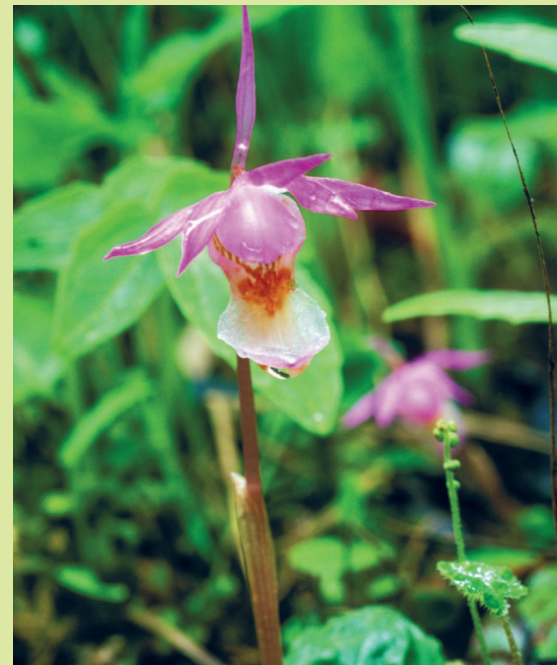
Калипсо луковичная, (Красная книга России)