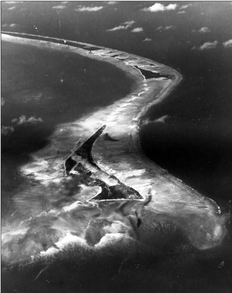
Аэрофотоснимок атолла Тарава, 9 сентября 1943 г.

идет именно о втором варианте. Хорошим примером мясорубки- assault была высадка на Галлиполи в 1915 году. Но ведь американцев это не касается, не так ли? В начале Тихоокеанской войны японцы дали примеры обоих вариантов. В Малайе они высадились при чисто символическом сопротивлении англичан, зато первая попытка высадки на Уэйк провалилась, причем с тяжелыми потерями для японцев.