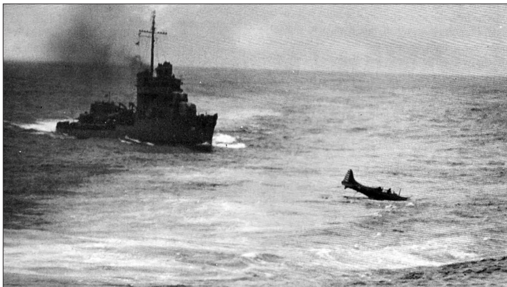
Американский эсминец подходит к сбитому самолету Douglas SBD с авианосца «Йорктаун», принимавшему участие в атаке на Макин, чтобы взять на борт пилота и стрелка, 1 февраля 1942 г.

Так американцы впервые обратили внимание на Гилбертовы острова. Но было понятно, что это демонстративная вылазка, и японцы не обратили на нее никакого внимания. Но вот следующее появление американцев на этом атолле имело самые тяжелые последствия.