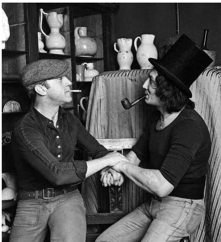
Владимир Высоцкий и Михаил Шемякин. Париж, мастерская М. Шемякина, август 1978 года.

«Вот он был такой... Вернейший и мужественный человек, он мог в дружбе, даже в приятельских отношениях заботиться о каких-то мелочах. Он приезжал ко мне и начинал объяснять, что кого-то ему надо женить, кого-то срочно выдать замуж... Я даже на него наорал: "Володя, ты занимайся творчеством! Ну чего ты носишься?!" Хотя, в общем, и я сам такой...»