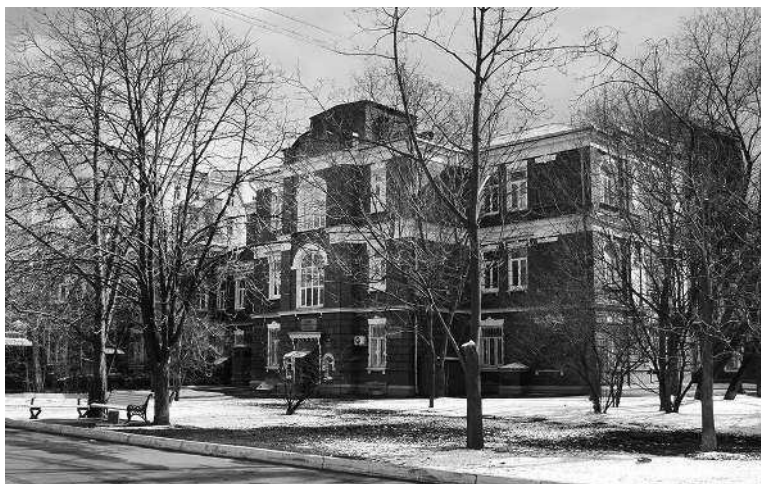
Дом, в котором родился Владимир Высоцкий