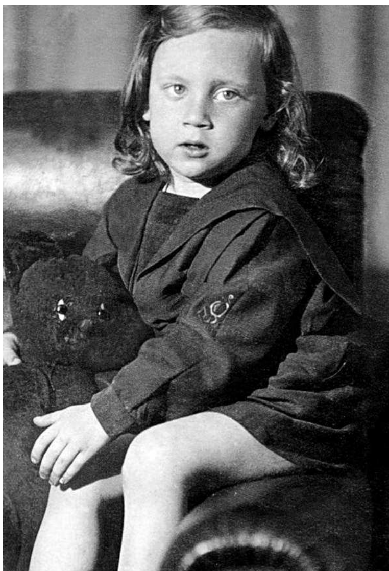
Владимир Высоцкий в детстве. 1940-е гг. Москва, июль 1941 г.