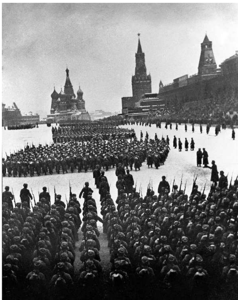
Москва в годы войны. Парад 7 ноября 1941 г.