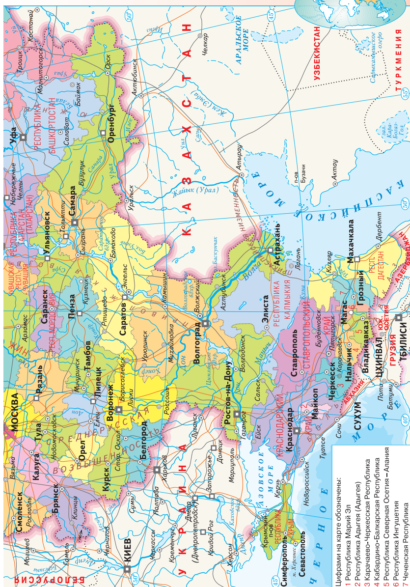
Масштаб 1:15 000 000