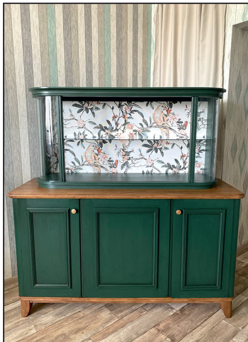
Сервант советской эпохи после до и после редизайна