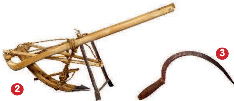
1 — ступа для взбивания масла; 2 — плуг; 3 — серп; 4 — древняя ручная мельница для помола зерна