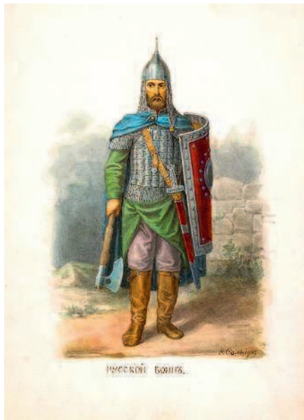
Воин XI–XII вв.