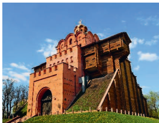
Золотые ворота в Киеве