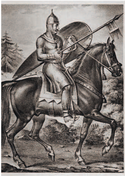
Конный воин X–XI вв.