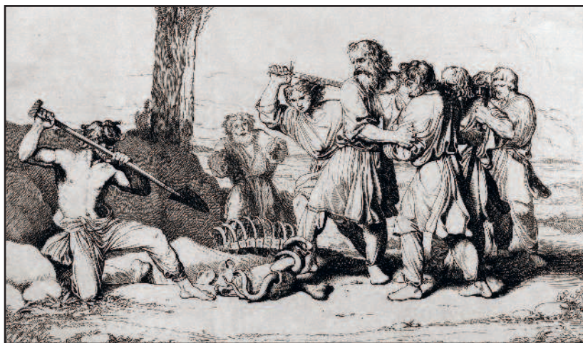
Смерть Вещего Олега. Гравюра Ф. А. Бруни