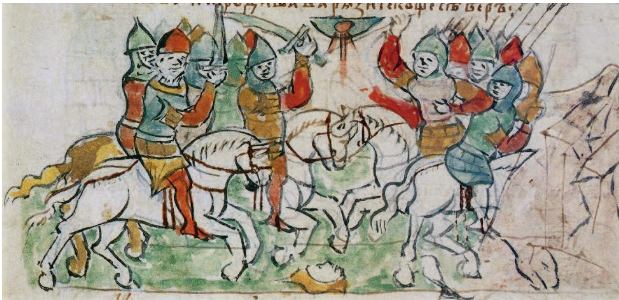
Ожесточенное сражение войск Мстислава Владимировича Тмутараканского с войсками Ярослава Владимировича Киевского и его союзниками-варягами

его сыновьями. Пали в ней Борис, Глеб, Святослав, Святополк Окаянный (по преданию — убил он трех своих братьев).