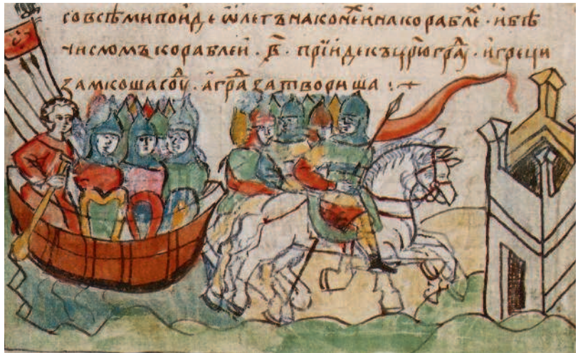
Поход Олега с дружиной на Царьград

По летописному преданию, жившие на севере словене ильменские пригласили на княжение варяга Рюрика, ставшего родоначальником династии правителей Руси — Рюриковичей. А затем, его преемник, Олег Вещий захватил Киев, убив местных правителей — Аскольда и Дира. Так из объединения двух центров государственности — Новгорода и Киева возникло Древнерусское государство.