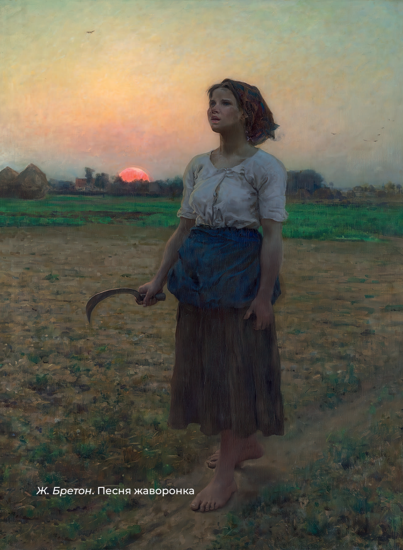
Ж. Бретон. Песня жаворонка