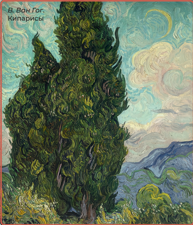
В. Ван Гог. Кипарисы