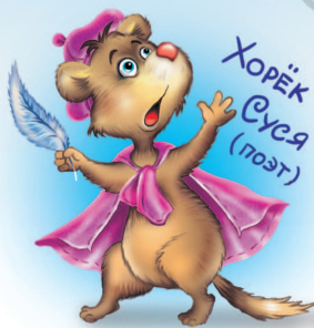
Хорёк Суся (поэт)

но это неважно. Крот наш, Шиша, новый туннель взялся рыть, под рекой. Ему кто-то наболтал, что там клад, вот он и роет. Так что теперь к реке так просто не подойдёшь, всюду то яма, то канава.