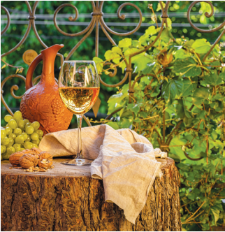
■ Бокал грузинского вина

3 Продегустировать грузинское вино и чачу. Разбираться в грузинском вине легко! Достаточно один раз посетить страну, и вы запомните поездку надолго. Саперави — красное сухое из Кахетии; мукузани — также красное сухое, якобы любимое вино Сталина; киндзмараули — красное сладкое; мцване — полусухое белое; цинандали — сухое белое из микрорайона Телави. Отличным сувениром станет покупка вина в оригинальной глиняной бутылке, расписанной вручную и украшенной красивыми цветочными мотивами.