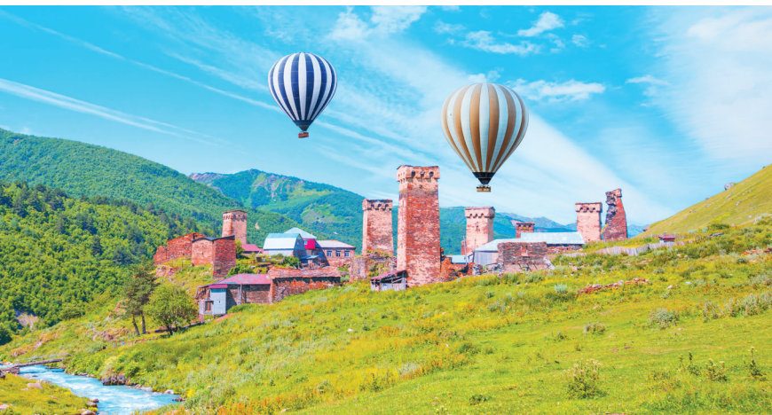
■ Гора Шхара — полет на воздушном шаре над деревней Ушгули — Верхняя Сванетия

В самый жаркий сезон спасайтесь от пекла в горных походах, на курортах черноморского побережья или в барах и ресторанах с работающими кондиционерами. Вариантов времяпрепровождения множество: полеты на воздушном шаре или паратлане, прогулки на катере, освоение трекинговых