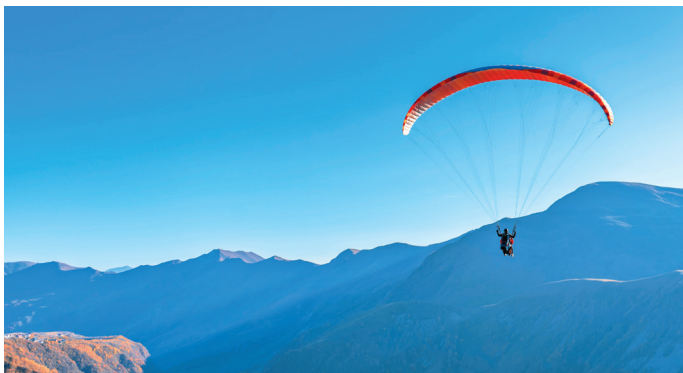
■ Полет на паратлане