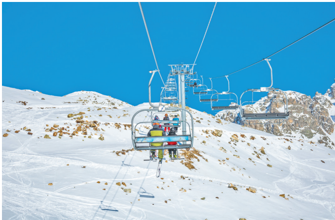
■ Кресельный подъемник на горнолыжном курорте Тетнулди в Кавказских горах, Верхняя Сванетия, Грузия.