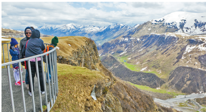
■ Смотровая площадка в Степанцминде

8 Смотровые площадки у Троицкой церкви и в Дарьяльском ущелье в Степанцминде. До смотровых площадок, расположенных довольно далеко от самого поселка, добраться непросто. Такси в обе стороны и ожидание водителя обойдется примерно в 3000 рублей. Выбирайте для осмотра солнечные дни, тогда увидите всю мощь и красоту окружающих пейзажей: горы с белоснежными вершинами, ледники, Терек и игрушечные деревенские домики вдалеке.