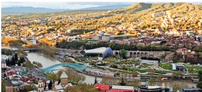
■ Вид на центр Тбилиси с крепости Нарикала

1 Крепость Нарикала в Тбилиси. Одно из самых популярных мест столицы. Со здешних смотровых площадок открываются захватывающие виды города, особенно любимые фотограмами.