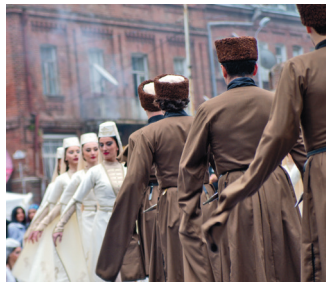
■ Фестиваль Тбилисоба

5 Фестивали. В Грузии постоянно проходят фестивали: молодого вина, просто любого вина, сыра, ча-чи, аджики, джаза, книг, осенние, летние, зимние — в любой сезон в любом районе страны можно бесплатно попасть на ярмарку или фестиваль с насыщенной программой.