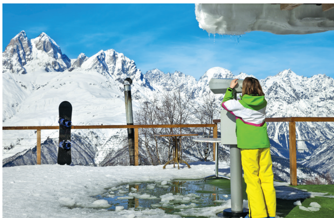
■ Смотровая площадка на горнолыжном курорте

9 Смотровые площадки на горнолыжных курортах. С них открываются потрясающие виды на сами горы, их снежные шапки, водопады, ущелья и отдаленные поселения. В общем, дух захватывает.