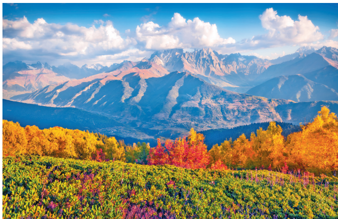
■ Горы Верхней Сванетии осенью

Сентябрь в Грузии настолько теплый, что фактически считается летним месяцем, хотя деревья уже начинают желтеть, а температура медленно ползет вниз. Сами грузины говорят, что приезжать лучше в сентябре, когда нет изнуряющей жары, а до холодов еще очень далеко. Ранняя осень, на мой взгляд, самое удачное время для путешествий: температура в это время комфортна, а туристический поток заметно ослабевает. Осенью одно удовольствие ходить пешком и исследовать каждый сантиметр этой волшебной страны. Ближе к зиме во всех регионах Грузии случаются сельхозярмарки, фестивали сыра и вина, превращающиеся в стихийный праздник с дегустациями и песнями, поучаствовать в которых может любой желающий. Не пропустите фестиваль аджики — в разных регионах он проходит в разные даты.