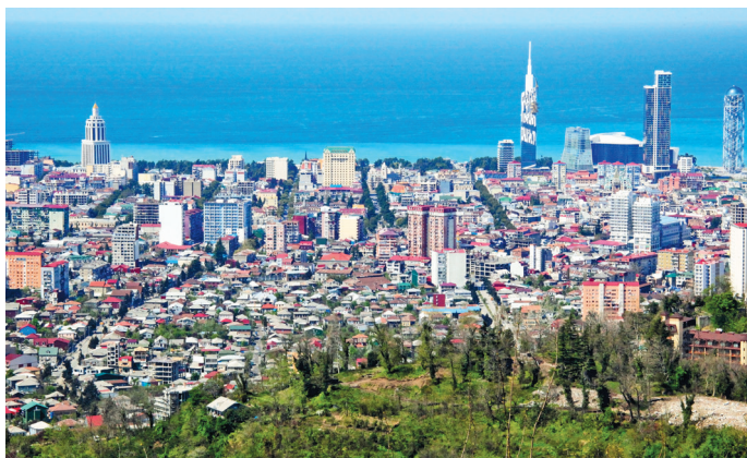
■ Вид на Батуми и море со смотровой площадки Арго

4 Смотровая площадка Арго в Батуми. Добраться до нее можно по канатной дороге, которая начинается на набережной у порта и поднимается на высоту 250 метров. Сама смотровая — это часть культурного центра с магазинами, кафе и амфитеатром, из которого открывается вид на море и город. За лучшими впечатлениями поднимайтесь сюда в вечернее время.