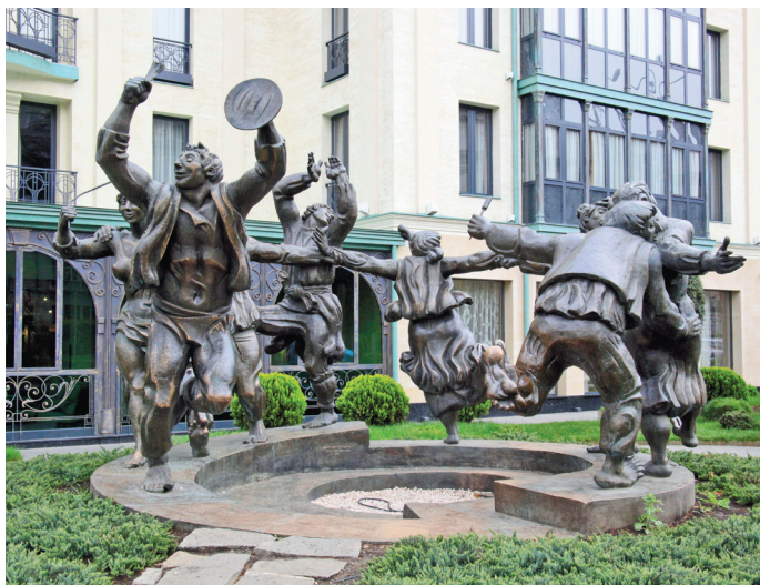
■ Скульптура «Берикаоба»

10 Арт-объекты и памятники. Конечно, больше всего их в столице. Высокая концентрация в районе улицы Николоза Бараташвили. Находите, изучайте и фотографируйте скульптуры тамады, дворника или фонарщика. В этом же районе вы найдете отреставрированный участок древней оборонительной стены города.