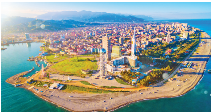
■ Приморский курортный город Батуми

8 Погружение в морскую пучину. В самый разгар грузинской жары отправляйтесь на пляжи Черного моря. Самые известные вы найдете, конечно, в Батуми: восемь километров набережной заняты галечными пляжами, попасть на которые бесплатно может любой желающий. Отдельно оплачиваются зонтики и шезлонги, но и на горячей гальке приятно лежать. Правда, народа в сезон здесь больше, чем в токийском метро в час пик. Гораздо меньше загрузка пляжей в Квариати или Сарпи недалеко от Батуми.