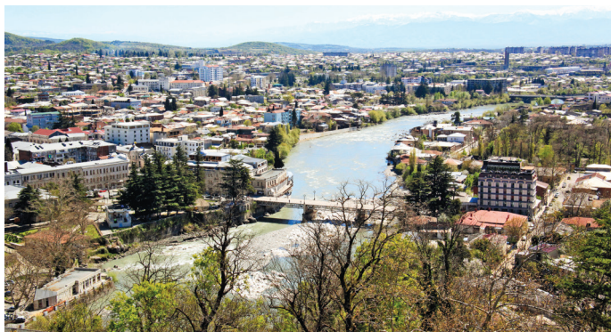
■ Весенний Кутаиси и река Риони

5 Канатная дорога и парк Габашвили в Кутаиси. Неплохие виды на город и бурлящую реку Риони открываются из окна дребезжащей кабинки канатки. За три минуты подъема можно посмотреть на город с небольшой высоты. Уже из самого парка угол обзора немного, но увеличивается. Для лучшей панорамы прокатитесь на колесе обозрения в этом парке — выше уже не заберетесь.