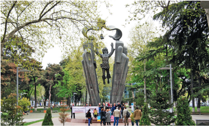
■ Памятник в парке Деда Эна

3 Кинопоказы. С ранней весны и до поздней осени, пока позволяет погода, на летней террасе кафе Мзиури (🏠 Тбилиси, Чавчавадзе, 23) в одноименном парке по пятницам показывают кино на грузинском языке. Заказывать в кафе еду и напитки не обязательно, но знайте, что здесь вкусно и все блюда приготовлены по принципу здорового питания. Кафе Мзиури поддерживает социально значимые проекты, такие как детские дни, публичные чтения, дискуссионные клубы и другие. В кафе нет детского меню, однако есть столик для пеленания, детские стульчики, книжки и рисование для детей.