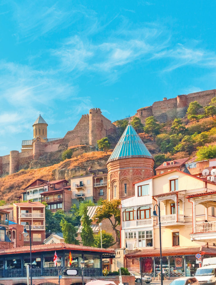
■ Вид на городские часы, площадь Старого Майдана и древнюю крепость Нарикала, Тбилиси

пребывание в этой стране еще более ярким. Здесь таксисты могут угостить вином, пока вы едете по маршруту, а незнакомая бабушка запросто завести разговор на смеси грузинского и русского языков. Здесь так приятно запивать только что приготовленный хачапури свежавыжатым гранатовым соком и сбегать с громких улиц в небольшие тихие переулки и задние дворики домов, фа-