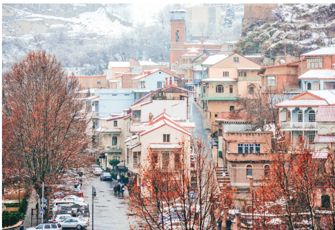
■ Вид на Старый город Тбилиси Сололаки зимой в снежную погоду

С середины декабря начинаются новогодние и рождественские базары — уютные фестивали, на которых можно купить украшения, сувениры и вкусные угощения. Не пропустите шествие «Алило» на Рождество — оно проходит повсеместно в Грузии. Ну а до марта хоть каждый день катайтесь на горных лыжах. Для этого работают три основных горнолыжных курорта — Гудаури, Бакуриани и Хацвали.