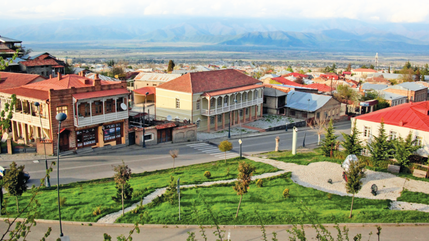
■ Вид на Телави и Алазанскую долину

6 Смотровые площадки в парке Надиквари в Телави. Уютный парк оснащен бесплатными смотровыми площадками, с которых открывается вид на Алазанскую долину. За комфортным созерцанием виноградников, гор и бескрайнего неба заходите в небольшие ресторанчики, расположенные в лучших местах парка. Тут и найдете и хлеб, и медитативное зрелище.