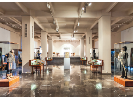
■ Национальный музей в Тбилиси

6 Музеи. 12 августа в Грузии отмечают Международный день молодежи, и по этому поводу многие музеи как в столице, так и в регионах работают бесплатно. В этот день можно посетить около десяти музеев в Тбилиси и столько же в Гори, Кутаиси, Зугдиди, Поти и других городах. Главное условие — возраст до 30 лет. На входе в музей необходимо показать паспорт. Бесплатно посетить некоторые экспозиции можно и в Международный день музеев 18 мая.