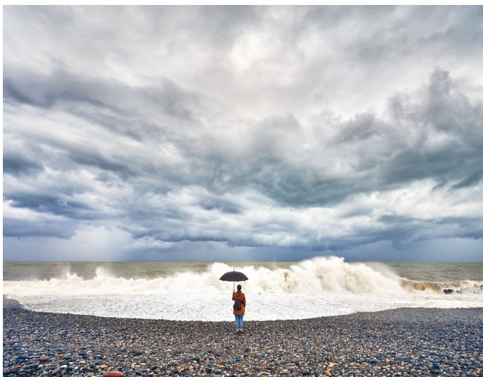
■ Пляж Батуми в дождливую погоду

Скрывайтесь от дождя в магазинах местных дизайнеров. Можно ничего не покупать, а просто пообщаться со стилистами (они же продавцы): вам расскажут историю бренда, магазина, улицы, города, страны и так далее. За разговорами и примерками время пролетит незаметно. Мой фаворит в этом плане — экологичный недорогой грузинский бренд Yuliko & Friends.