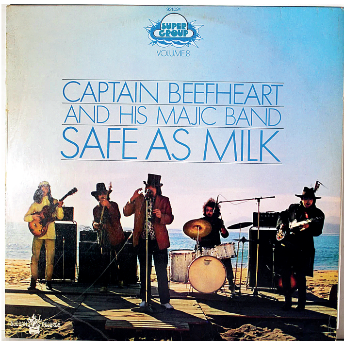
Обложка французского переиздания альбома Captain Beefheart and his Magic Band «Safe as Milk», 1969 год; фотография выступления группы в Каннах.