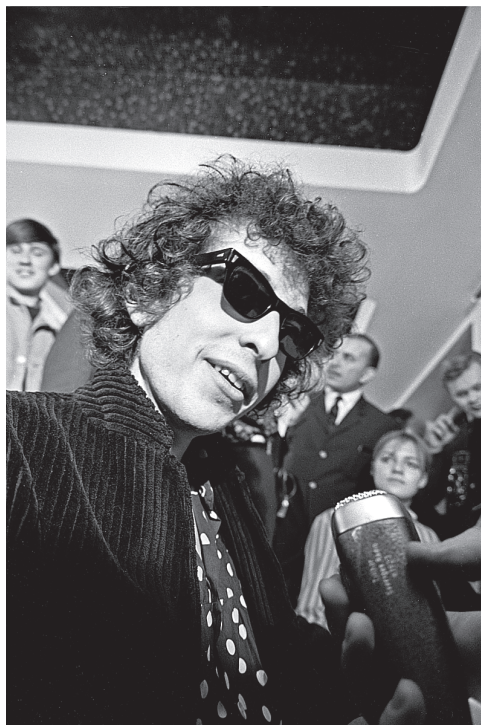
Боб Дилан во время гастролей по Швеции, апрель 1966 года.