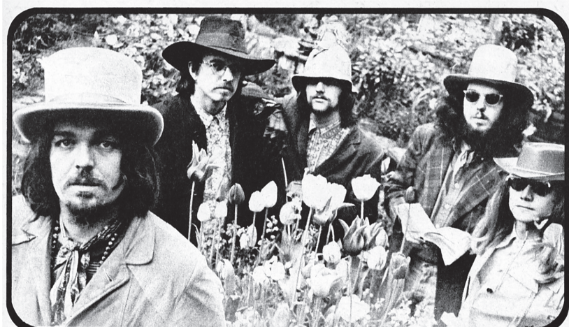
CAPTAIN BEEFHEART (left) and THE MAGIC BAND. Their next LP is a double album set to be issue on Verve.