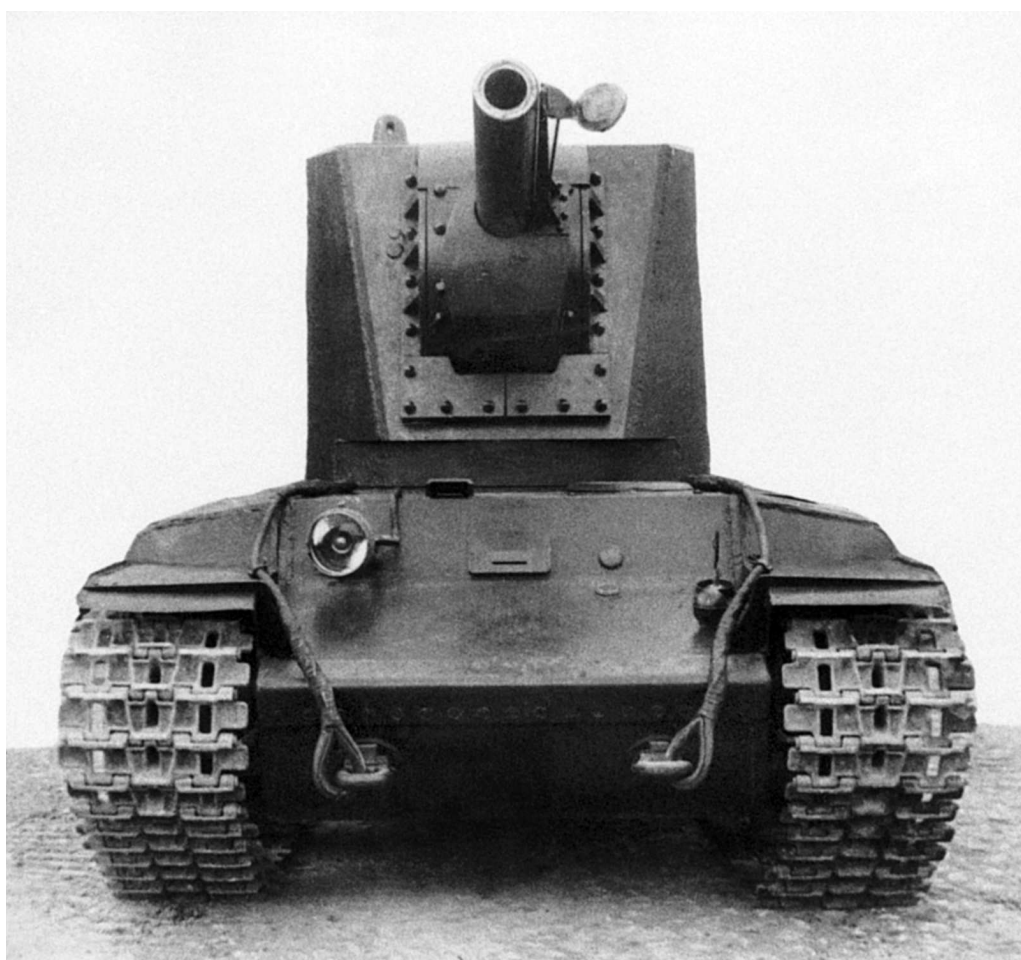
Танк КВ № У-4, вид спереди. Весна 1940 года. На этом фото хорошо видна крышка, установленная на стволе гаубицы, и механизм для ее открытия и закрытия.

При начале изготовления на заводе на каждый КВ заводилось так называемое дело машины, в которое вносились номера корпуса, башни, двигателя, пушки, коробки перемены передач и т. д., а также информация о ходе ее сборки (включая фамилию бригадира), дефектах, обнаруженных в ходе заводского и военпредовского пробегов. При окончательной при-