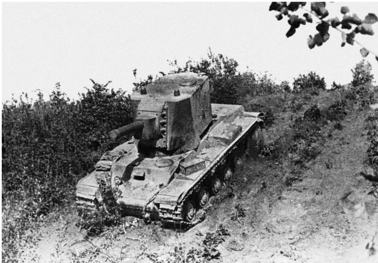
Испытание танка № У-1 с большой башней. Район Ленинграда, июнь 1940 года. На этом фото хорошо видна крыша танка.