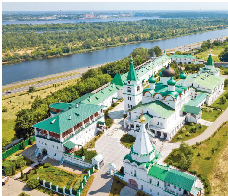
Печерский Вознесенский монастырь

Вечер. Завершите день прогулкой по Рождественской улице (▷38) и ужином в ресторане «Безухов» (▷59).