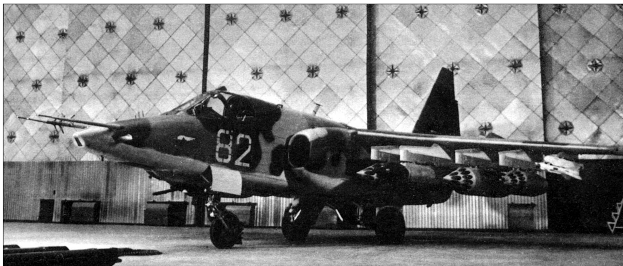
Второй опытный самолет Т8-2 в сборочном цехе МЗ «Кулон», зима 1977 года

профиль позволил выполнить эту процедуру безболезненно). После выполнения этих работ, законченных к февралю 1977 года, горизонтальное оперение больше не попадало в реактивную струю двигателей, тряска хвостовой части прекратилась, и испытания были продолжены. 29 марта 1977 года Т8-2Д был на аэродроме Кубинка на земле и в воздухе продемонстрирован польской делегации.