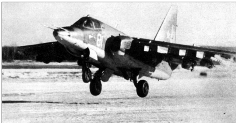
Испытания Т8-1 на заснеженном аэродроме. Самолет доработан увеличенным по высоте килем и несет под крылом 100-кг авиабомбы и ракеты «воздух-воздух»

— обладает широкими возможностями при действии по наземным и воздушным целям в тактической и ближ-