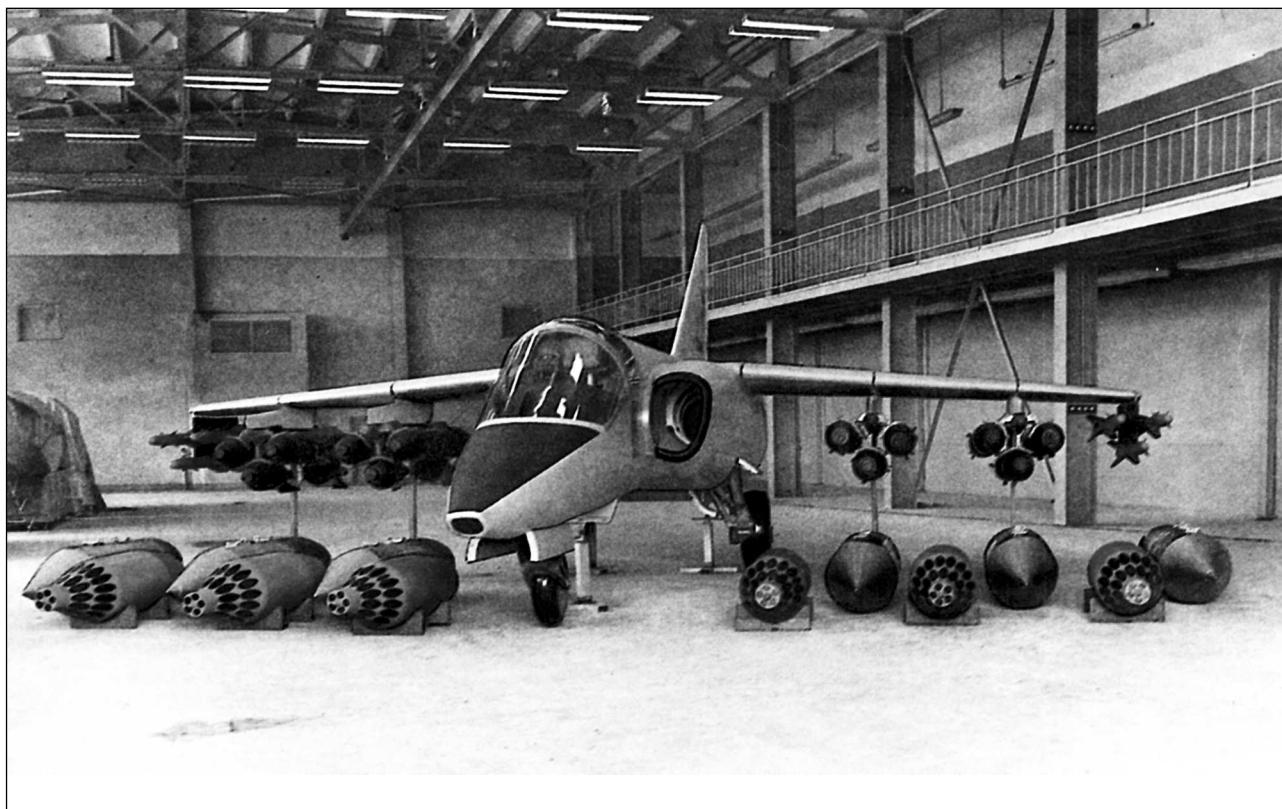
Макет СПБ в цехе МЗ «Кулон», 1969 год