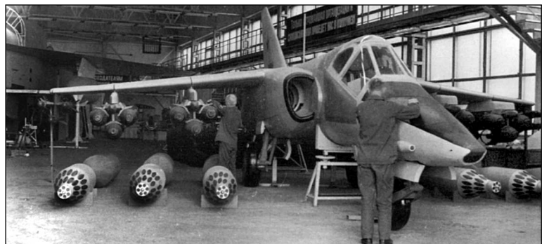
Доработанный макет легкого самолета-штурмовика (ЛСШ) с выкладкой вариантов вооружения

Изначально наладить выпуск штурмовиков предполагалось на Новосибирском авиационном заводе им. В.П. Чкалова. Передача конструкторской документации началась уже в конце 1969 года с тем, чтобы завод участвовал в строительстве опытных самолетов. Но в то время завод был загружен работами по Су-24, испытывал проблемы производственного и технологического толка и без того имел значительное отставание от плана. К тому же финансирование работ по штурмовику так и не