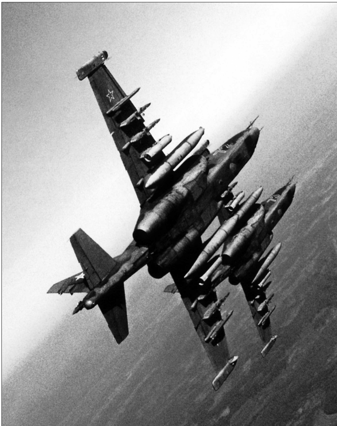
В полете на полигон. Пара штурмовиков Су-25 несет ПТБ и штурмовые авиабомбы ОФАБ-250ШЛ