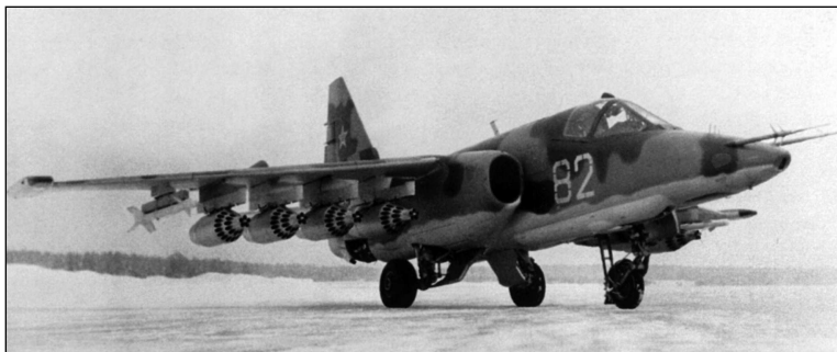
Т8-2 на аэродроме ЛИИ МАП в Жуковском. Под крылом блоки НАР УБ-32А-73 и макеты ракет «воздух-воздух» Р-3С

Тем же Постановлением предписывалось заменить двигатели на самолете на более мощные, поскольку с Р9-300 Су-25 недотягивал до заданных летных характеристик. Взгляды конструкторов вновь обратились к еще не существующим перспективным ТРДД, но на «бумажных» двигателях самолет летать не мог. Вновь требовалось иное, доступное решение. Первоначально рассматривался вопрос о форсировании Р9-300, который в варианте «изделие 39Ф» мог развивать тягу до 3800 кгс. Однако после всестороннего рассмотрения характеристик этого варианта двигателя стало ясно, что и с ним выполнить в полной мере все требования ТТТ на самолет невозможно. Все работы по Р9-300 по указанию МАП были в итоге свернуты.