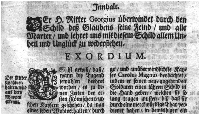
Симеон Метафраст. Предисловие (Exordium) к Житию святого Георгия Победоносца. Текст за 23 апреля

В примере со святым Георгием Победоносцем мы имеем много вариантов текстов его жития, которые принимают учёными. Некоторые из них считаются апокрифами — произведениями, не признаваемыми в христианской традиции. Но нельзя забывать об уже отмеченном нами жанре, который можно назвать не биографией (хотя что плохого в этом греческом слове?), а жизнеописанием. Это, пожалуй, самое подходящее определение.