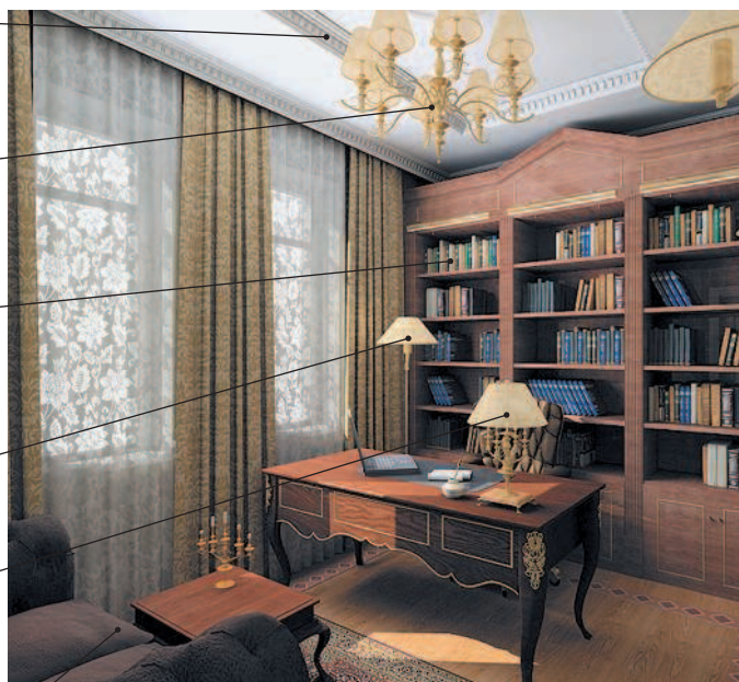
書齋 [shosai] сёсай кабинет