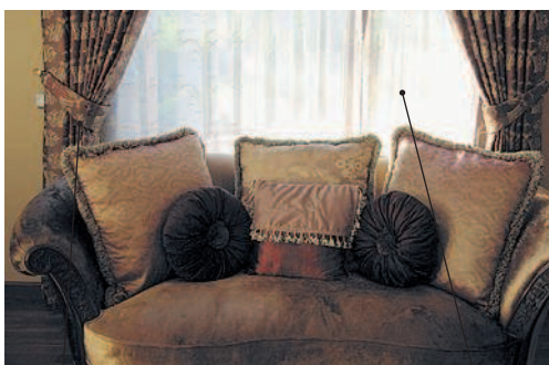
カーテン [kāten] ка:тэн портъера