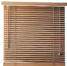
ベネチアンブラインド [benechianburaindo] бэнецянбурайндо жалюзи