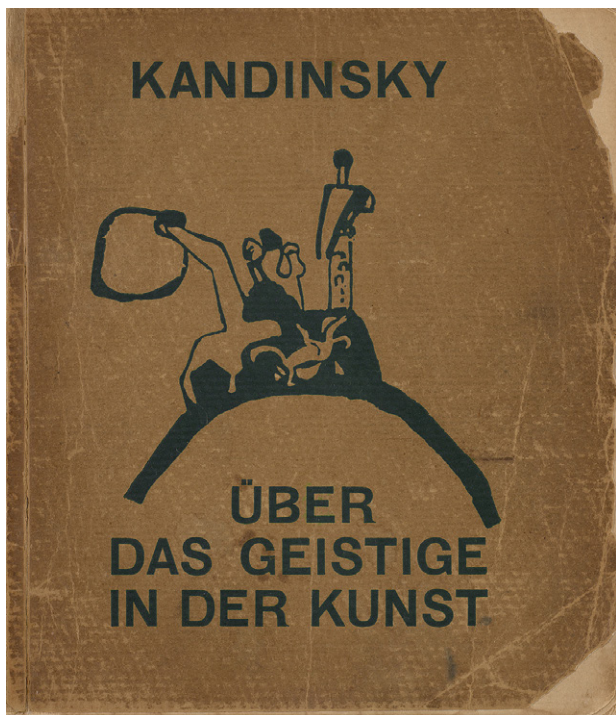
Обложка философского трактата Василия Кандинского «О духовном в искусстве»