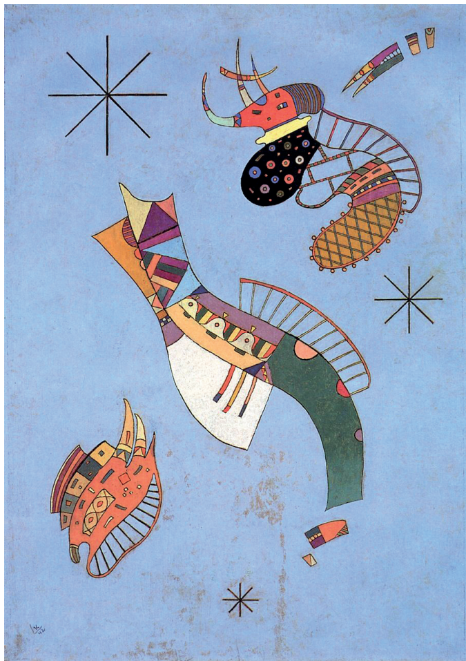
Три звезды. 1944