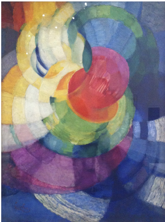
Франтишек Купка. Диски Ньютона (этюд для «Фуги в двух цветах»). 1912