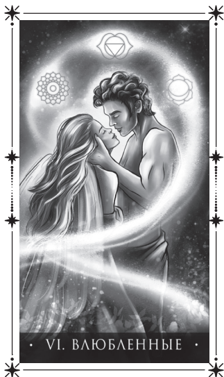
· VI. ВЛЮБЛЕННЫЕ ·

Основная задача — принять выбор своей души. Душа приходит в определенное время, место и тело — выбирает, воплотиться мужчиной или