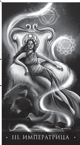
· III. ИМПЕРАТРИЦА ·

Третий аркан хорошо подсвечивают мужчины. Если в карте жизни у женщины стоит третий аркан, то мужчина такую точно не пропустит. От таких женщин не уходят, таких женщин боготворят и одаривают подарками. Легко проверить третий аркан в минусе материальным выражением мужской