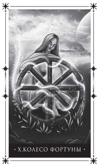
• X. КОЛЕСО ФОРТУНЫ •

Если он у вас в плюсе, то вы самый удачливый человек в мире! Вы попадаете в нужное время и нужное место, вы всегда точно попадете туда, где вам надо находиться для роста. Если у вас в плюсе этот аркан, то вы используете свои возможности на 100 %. У X аркана есть и деньги, и слава, и возможности, и сопутствующая удача. Но если Колесо Фортуны у вас в минусе, то ваша жизнь — это настоящая череда неудач. С X арканом связа-