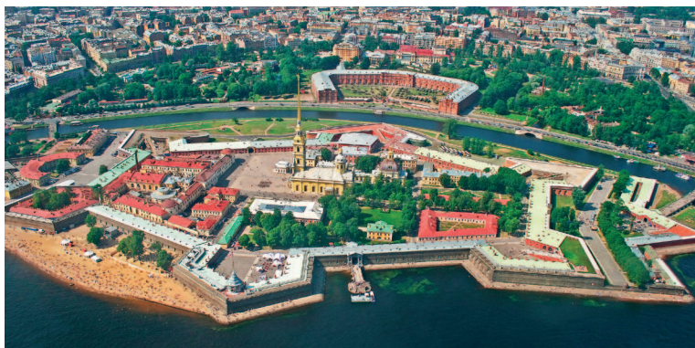
▲ Вид на Петропавловскую крепость с высоты. Хорошо видны бастионы. Полоса берега была «досыпана» позже, первоначально стены вырастали практически прямо из воды

Постепенно крепость стали называть Петропавловской (по названию церкви, которая тогда еще не превратилась в огромный собор с позолоченным шпилем), а Санкт-Петербургом начали именовать город, строившийся под ее защитой.