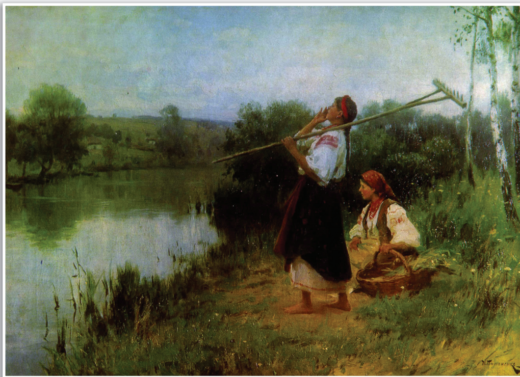
Н. Пимоненко «У перевоза», 1896.

Праздник Ивана Купалы считается очищающим 18 , связывается с борьбой светлого и тёмного земных начал и с победой, которую одерживают светлые силы, символизирующие добро, чистоту, Бога, любовь. Как отмечает М. Фасмер, «начиная с этого дня разрешалось купаться, так как, согласно народному поверью, Иоанн Креститель в этот день прогонял из воды злых духов» 19 . После Ивана Купалы разрешалось также заготавливать травы и другие растения, поскольку и они теперь становились чистыми, свободными от тёмных, колдовских сил. И это было как раз вовремя, ведь именно к солнцестоянию растения наливались соками, набирались сил, готовые отдавать их людям.