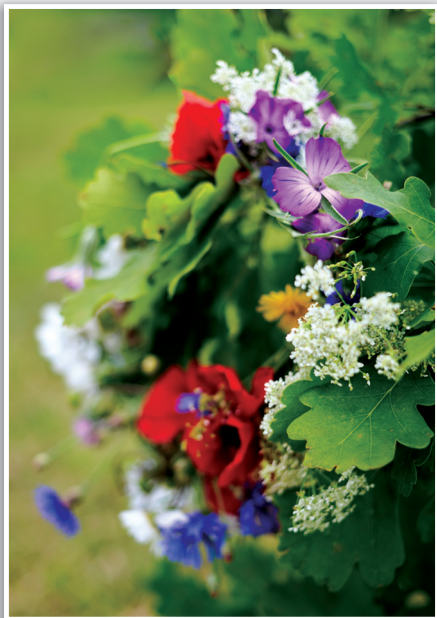
Традиционный купальский венок.

Не туман белеет в тёмной роще, Ходит в тёмной роще Богоматерь, По зелёным взгорьям, по долинам Собирает к ночи божьи травы.