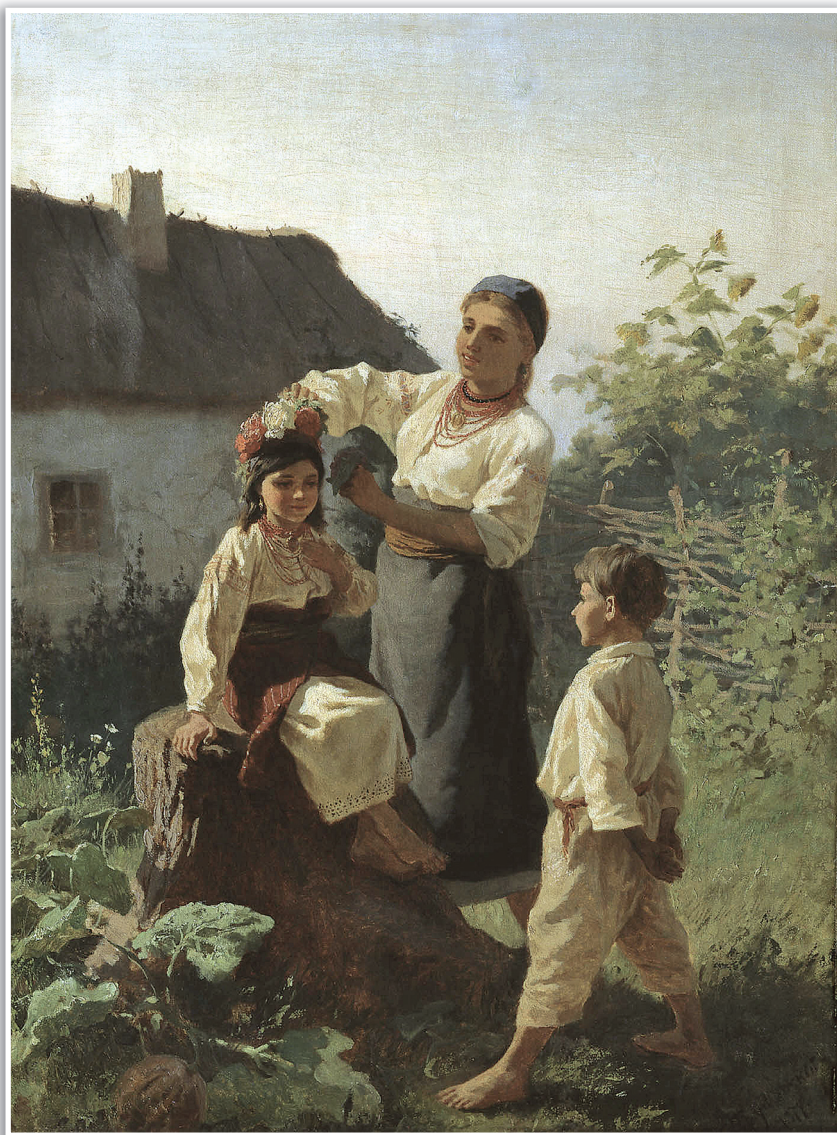
К. Трутовский «Надевают венок», 1893.

замужестве 25 . А ещё венок — символ бесконечности, вечности жизни, которая никогда не завершается, просто переходит из одного состояния в другое. В купальской традиции венки плели девушки, и эти венки становились символами чистоты, юности, женственности, защиты жизни от посягательств тёмных сил.