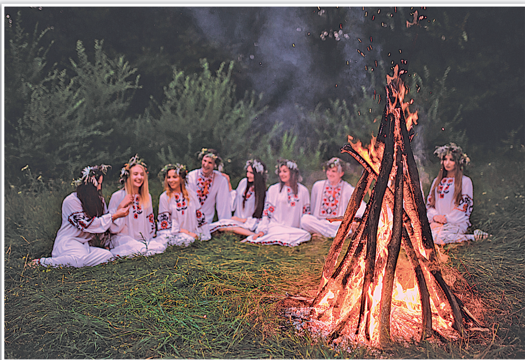
Современный фольклорный фестиваль, приуроченный к дню Ивана Купалы.

Как день летнего солнцестояния этот праздник, выражающий общечеловеческие ценности и интересы 2 , отмечают и ныне во многих европейских странах 3 и в современной России на многочисленных фольклорных фестивальных площадках.