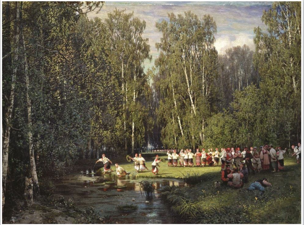
И. Суходольский «Вечер под Ивана Купалу», 1887.

Накануне начинали собирать травы, корни и цветы, украшали зеленью избы, подворье и хозяйственные постройки, домашний скот и самих себя. Верили, что зелень, символизирующая жизнь, особенно сильная, бурно растущая в эти дни года, способна прогнать нечисть, которая несла смерть и жизненных токов природы боялась.