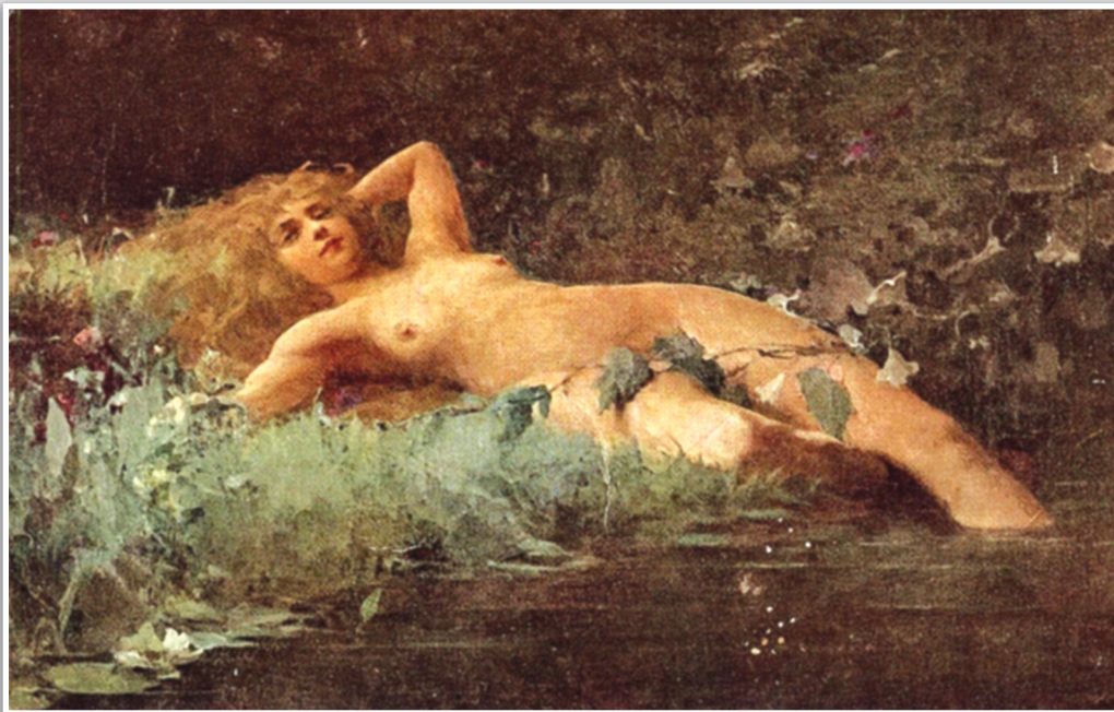
И. Горохов «Русалка», 1912.

С другой стороны, в день Ивана Купалы чувствовалось, что к людям подступает что-то опасное, потустороннее. Приоткрывается завеса между «этим» и «тем» мирами, становится проницаемой граница между ними. Выходит на охоту нечистая сила: лешие, водяные, русалки. Они тоже связаны с играющей своими силами природой и потому особенно опасны. В ночь на Ивана Купалу человек противостоит нечисти, он должен выдюжить, чтобы потом спокойно жить до следующей опасной даты.