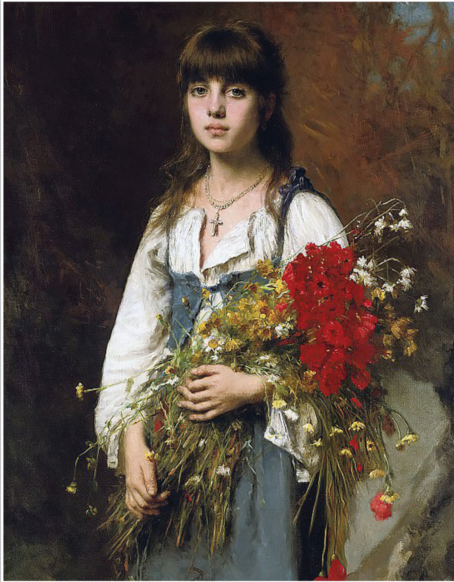
А. Харламов «Летнее время», 1900.

Спешили к Ивану Купале почистить колодцы, вытащить из них всю грязь, которая скопилась за год. Тогда вода в них станет не только чистой и на вкус приятной, но и целебной. Да и нечистая сила в обновлённый колодец не полезет. Что ей там делать?