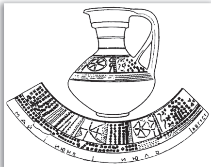
Кувшин — солярный календарь славян. Археологическая находка.

Б. А. Рыбакова 8 , на сосудах высечены обозначения каждого календарного месяца в соответствии с сельскохозяйственными работами славян.