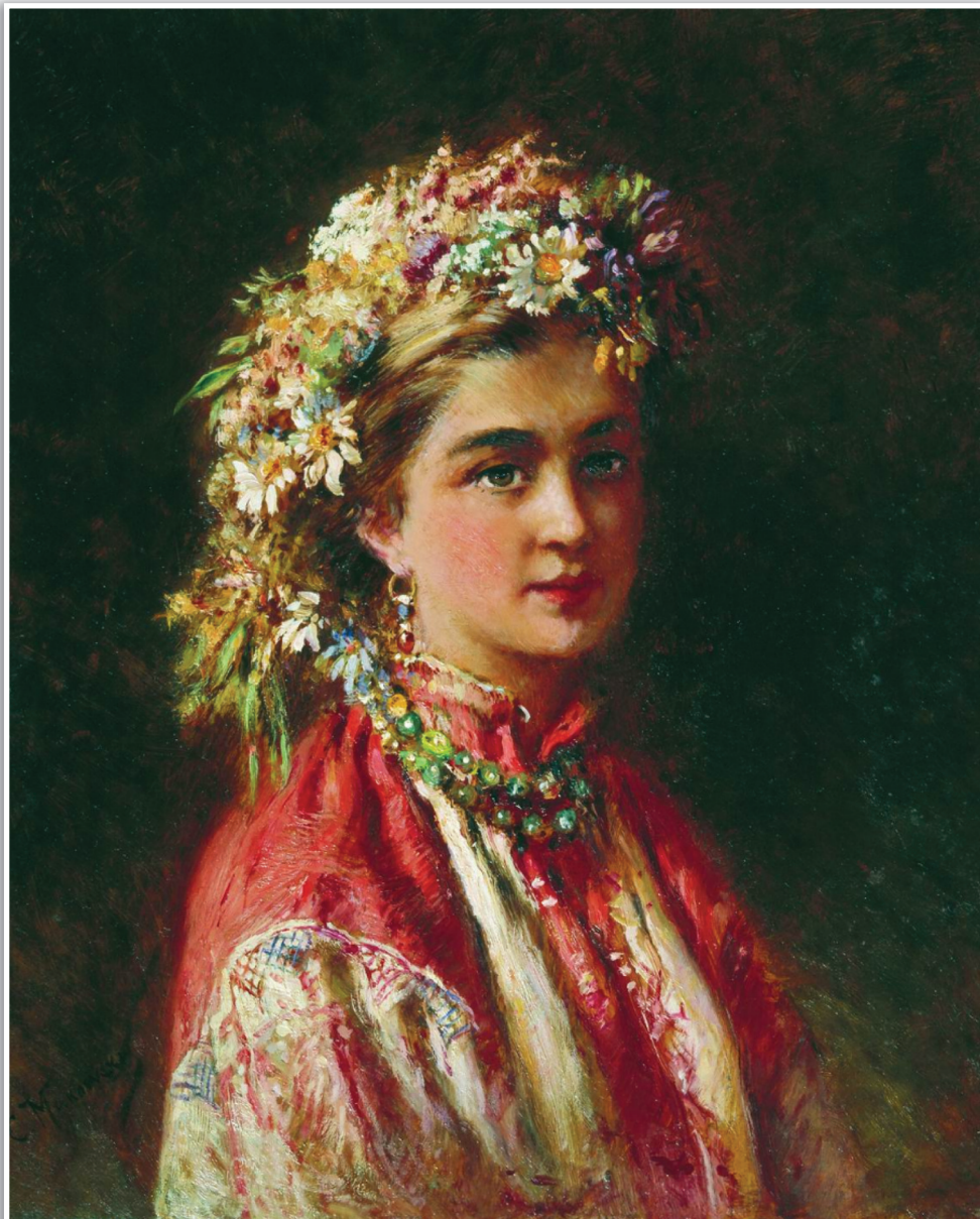
К. Маковский «Девушка в венке», 1890-е гг.