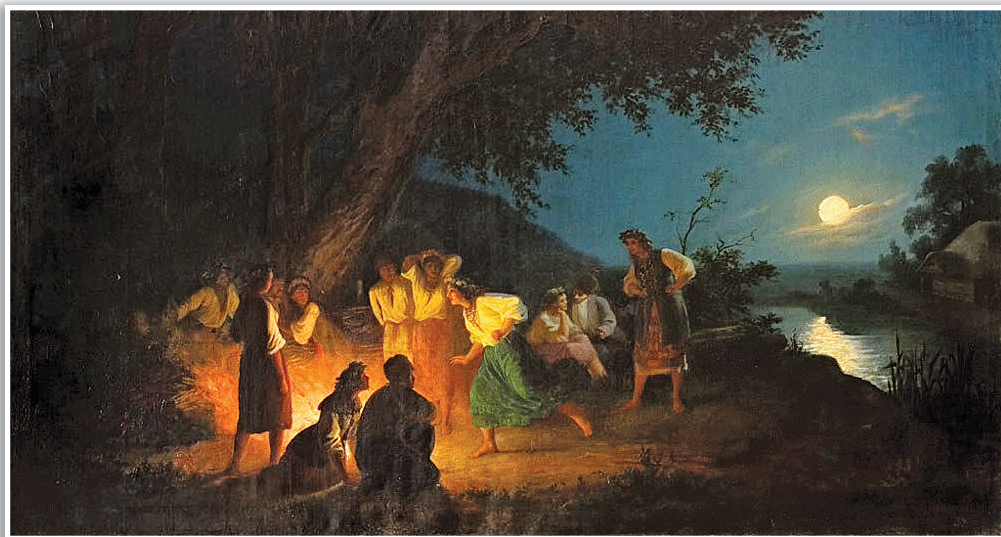
Г. Семирадский «Ночь накануне Ивана Купалы», 1880.

У предков наших в календаре было несколько значимых праздников, определяющих, по их мнению, жизнь на весь будущий год, и один из них — Иван Купала — «главный летний праздник народного сельскохозяйственного календаря» 1 . Об этом сообщает нам и пословица: «Иван Купала делит год пополам». Многие люди отсчитывали по этому празднику, ощущая его как животворящий.