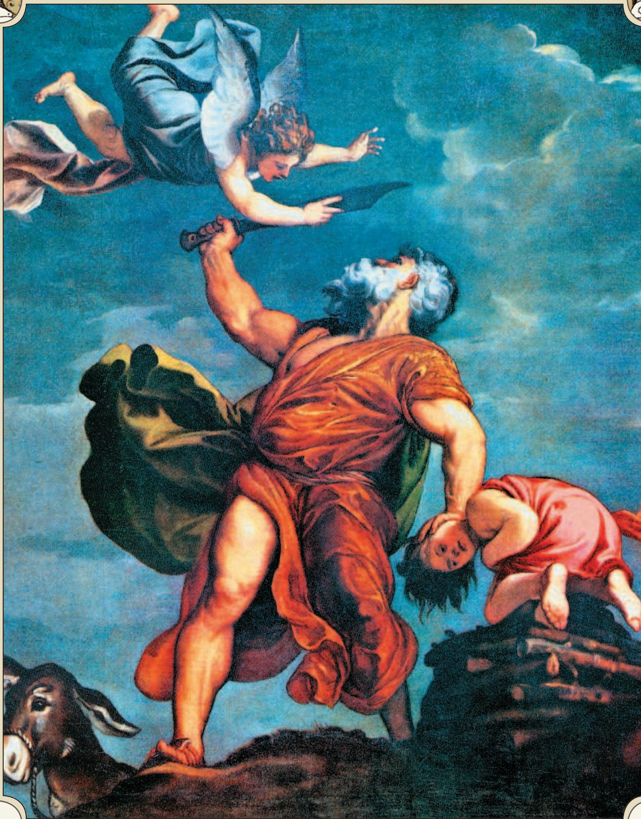
Жертвоприношение Авраама. Тициан Вечеллио. 1542–1544 гг.