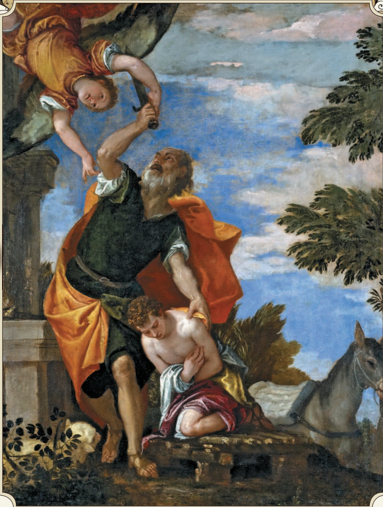
Жертвоприношение Авраама. Паоло Веронезе. 1586 г.