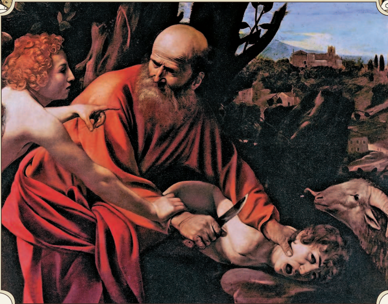
Жертвоприношение Авраама. Микеланджело да Караваджо. Ок. 1599 г.

что у него было, своему сыну Исааку, а сыновей от наложниц, которых у него было очень много, щедро одарил землями на востоке.