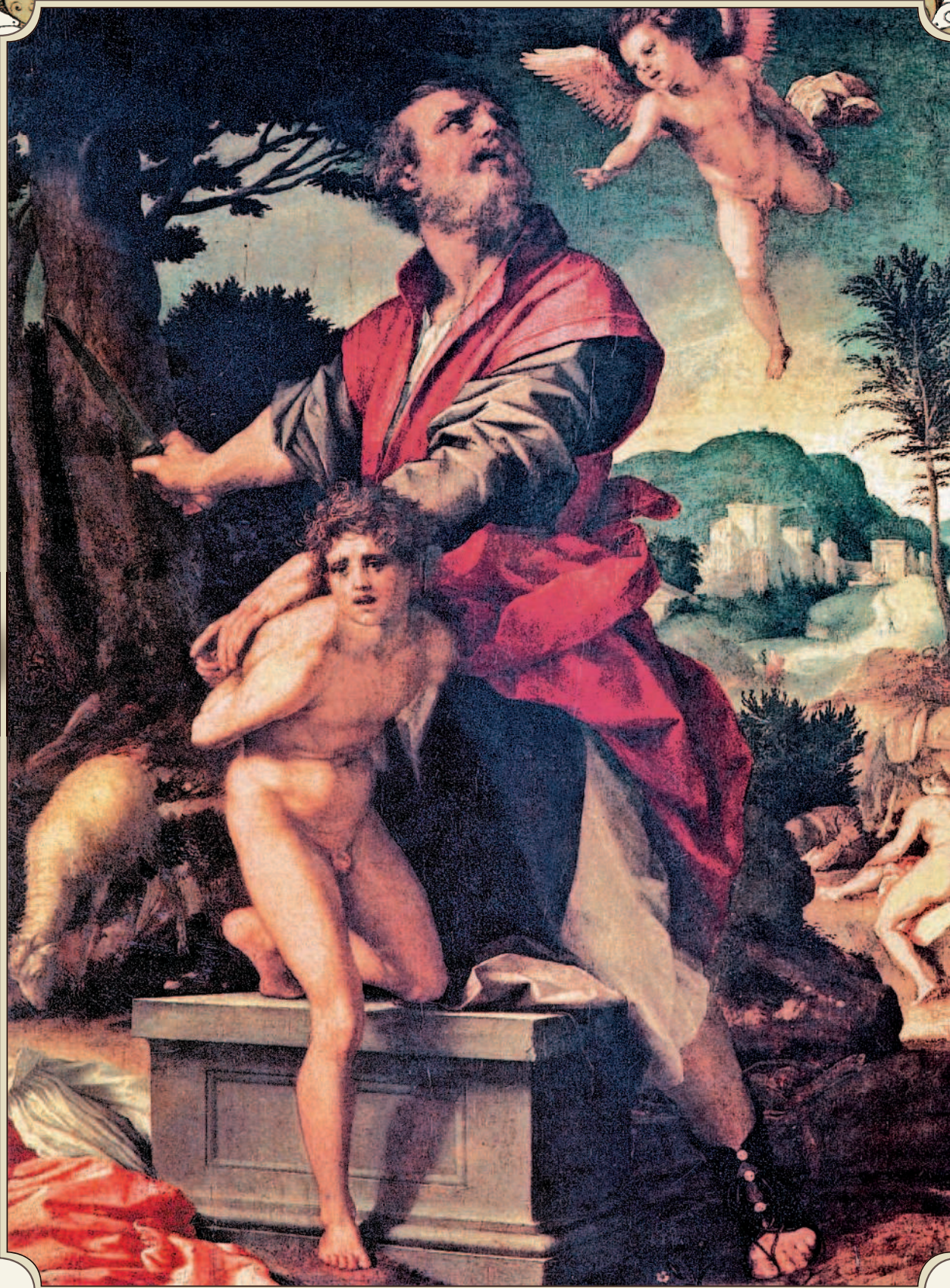
Жертвоприношение Авраама. Андреа дель Сарто. 1528 г.