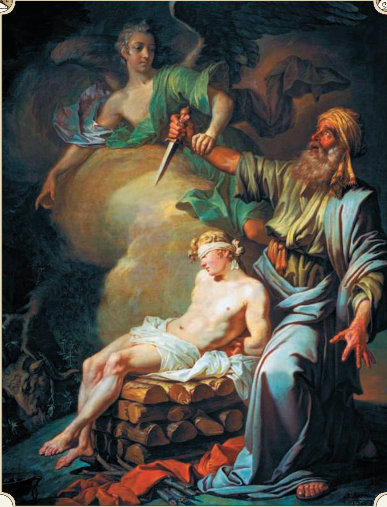
Авраам приносит в жертву сына своего Исаака. А. П. Лосенко. 1765 г.