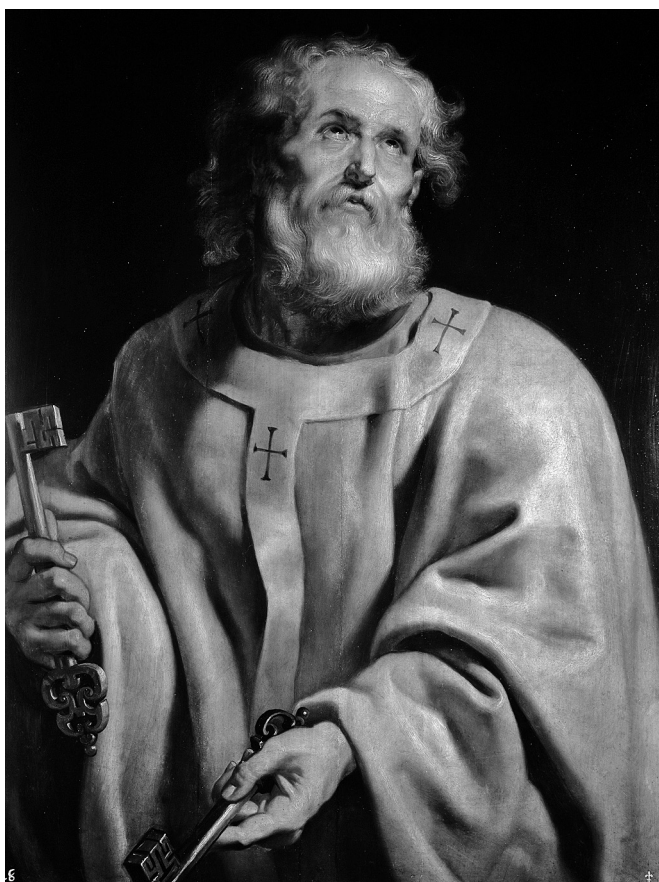
«Апостол Петр». Питер Пауль Рубенс. 1610–1612 гг.

нередко подчинялся порывам сердца более, чем голосу рассудка; способный увлекаться часто до самоотвержения, он вместе с тем не всегда умел благоразумно сдерживаться в своих увлечениях. Увидав кроткое лицо Христа и услышав обращенные к нему пророческие слова, Симон воспылал горячей любовью к Иисусу, он уже уверовал, что видит пред собою Христа, посланного Богом для спасения мира. Однако Симон-Петр