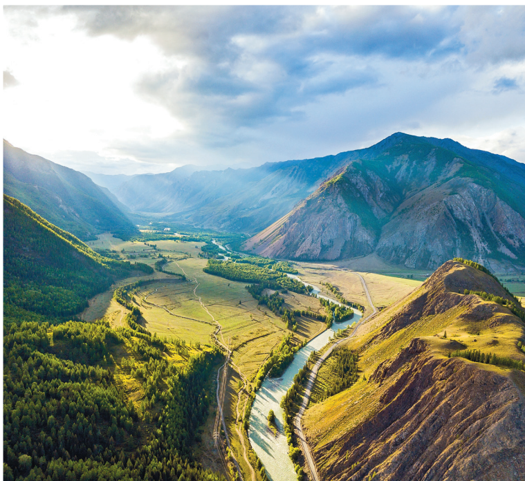
Долина реки Чуя

Дорога, отходящая от него на восток, приведет вас к глубоко-