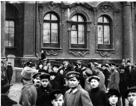
После взятия Зимнего дворца. Петроград. 26 октября 1917.

К группе думских депутатов прибавилась сочувствующая публика. Шедшая стройными рядами процессия, хором исполняющая