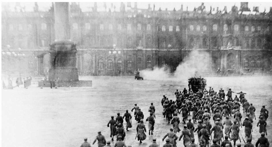
Штурм Зимнего дворца в октябре 1917 года. Кадр из фильма «Октябрь» Сергея Эйзенштейна. 1927

говорилось: «...штурм Зимнего дворца уже шел, когда “Аврора” дала залп из 6 орудий, но холостыми снарядами. Защитники дворца ринулись бежать». Хотя стреляли примерно в 21.45, а штурм начался несколькими часами позже.