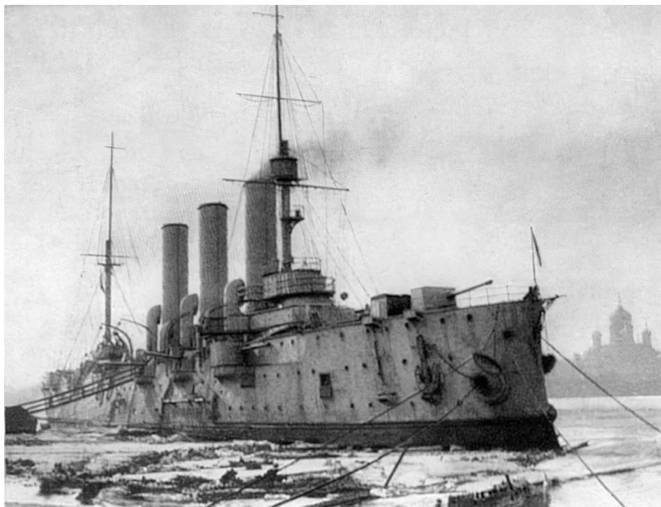
Крейсер «Аврора» на Неве. Петроград. Апрель 1918

Стоявший на Неве крейсер «Аврора» дал из носового орудия один холостой выстрел в качестве сигнала к началу штурма Зимнего дворца, где заседало Временное правительство.