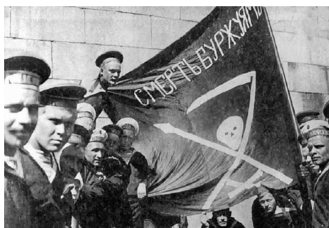
Моряки с линкора «Петропавловск». 1917