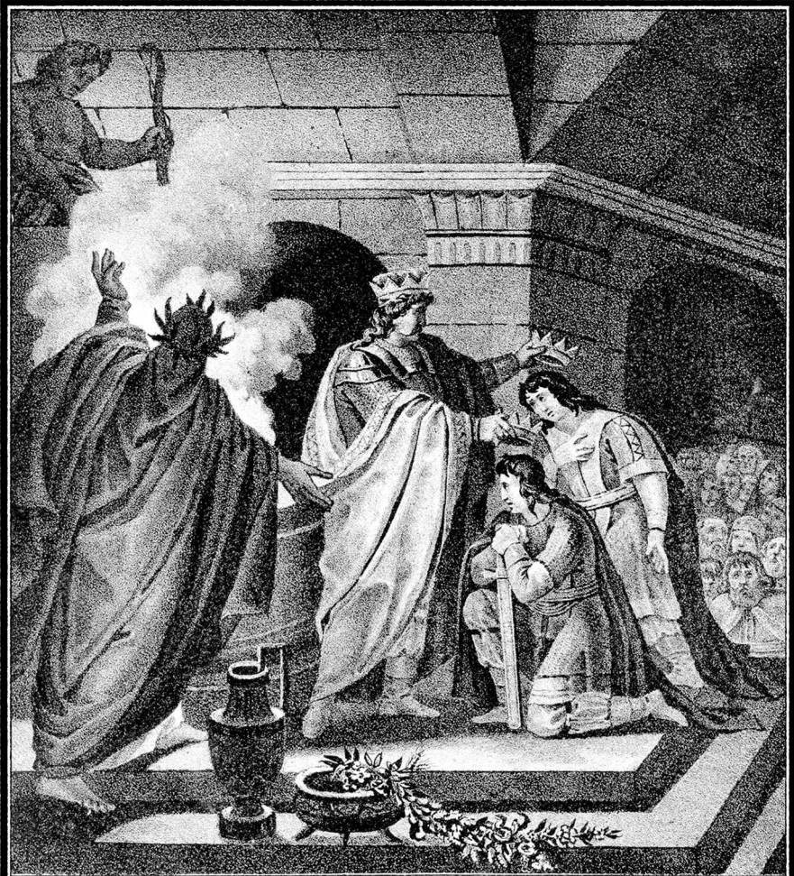
ЖЕРТВОПРИНОШЕНИЕ РЮРИКА 862 ГОДА