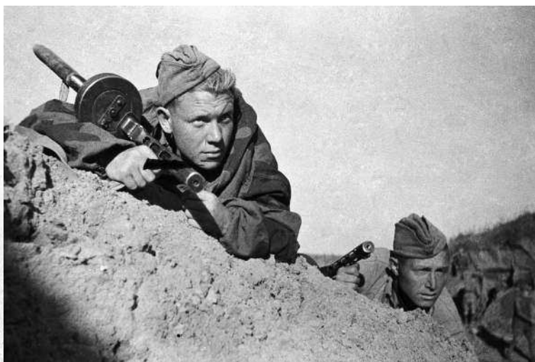
Солдаты наблюдают за выдвигающимся противником. Оборона Севастополя.