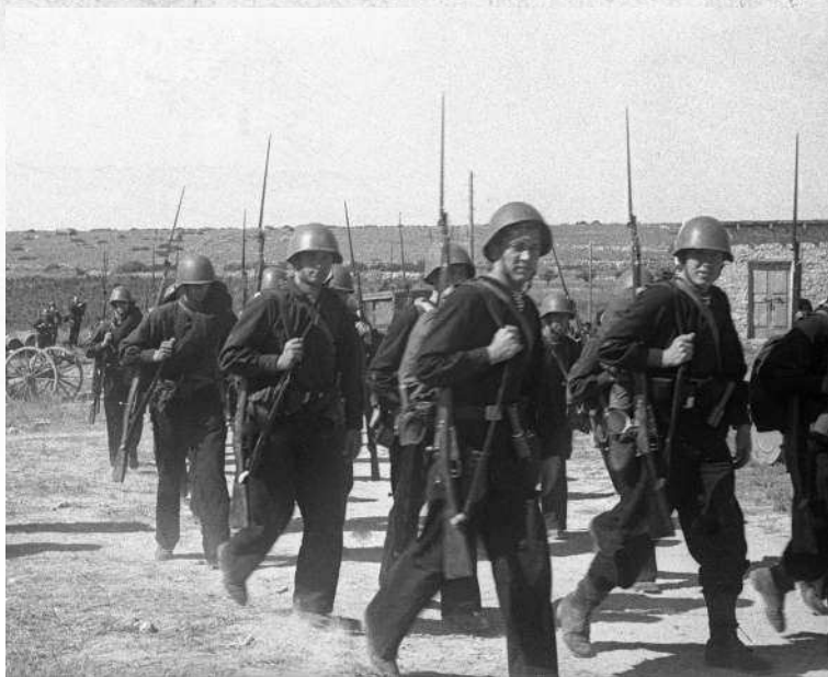
Советские моряки идут на помощь защитникам Севастополя