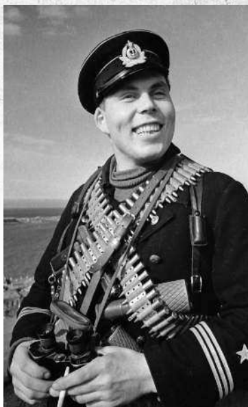
Старшина-разведчик во время обороны Севастополя.