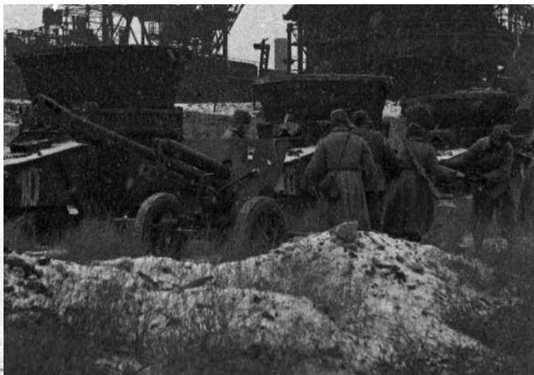
Советские солдаты в Севастополе во время обороны города в 1941 году.

«Крым, 4 ноября. (По телеграфу от спец. корр. «Красной звезды».) В Крыму идут напряженные кровопролитные бои. Немцы напрягают все свои усилия, чтобы повысить темп наступления. И это им кое-где удается. В направлении