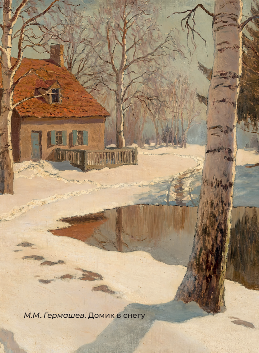
М.М. Гермашев. Домик в снегу