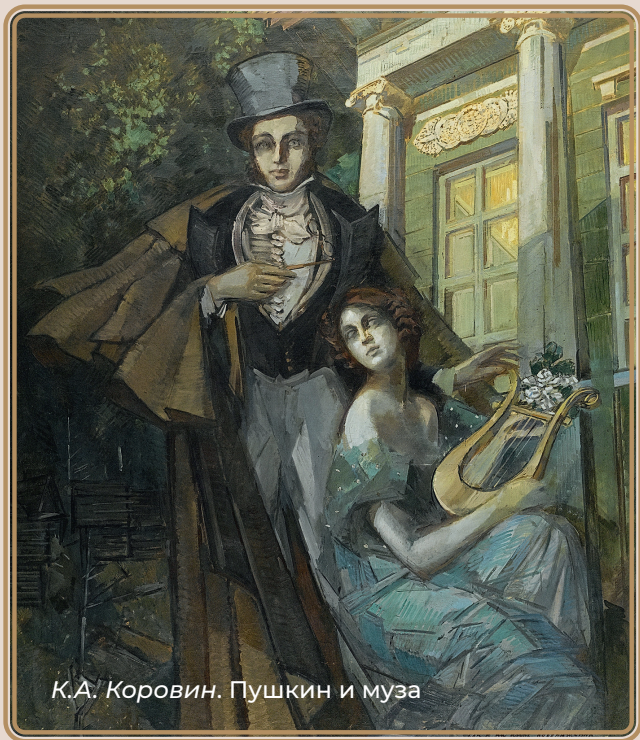
К.А. Коровин. Пушкин и муза