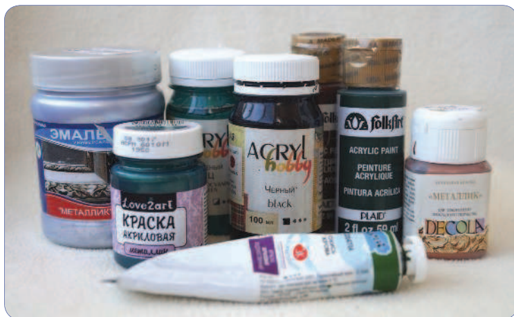
Акриловые краски различных производителей

Дерево и МДФ. Предварительная обработка изделий из дерева и МДФ зависит от качества этих изделий. Если предметы новые, не окрашенные и имеют высокую степень обработки поверхности, то их можно не грунтовать, а сразу покрыть акриловой краской нужного цвета в 1-2 слоя. Если же изделия невысокого качества, то имеет смысл вначале положить 1 слой клея ПВА, высушить, ошкурить до гладкости и затем покрыть акриловой краской. В обоих случаях после высыхания акрила следует по-