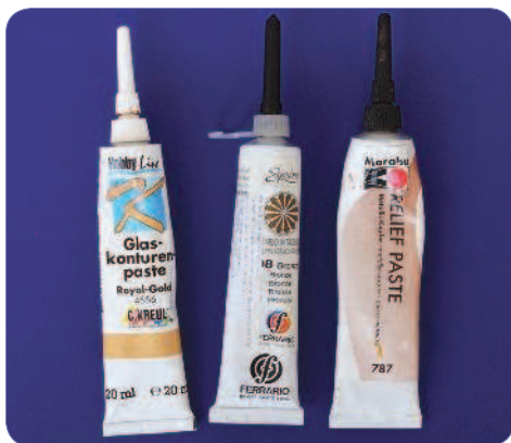
Контуры некоторых зарубежных производителей. Hobby Line, Ferrario, Marabu

Контуры фирмы «Декола» имеют не очень большую цветовую гамму, более жидкую консистенцию, но именно поэтому они отлично подходят для крупных точек. При высыхании они не теряют своей округлой формы.