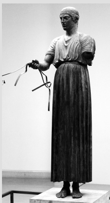
«Дельфийский возничий», один из немногих сохранившихся оригиналов античной бронзы (V в. до н. э.)

К концу XV века до н. э. критские дворцы были разрушены, а цивилизация пришла в упадок. Предположительно, причиной послужили набеги древнегреческих племен с материка или природные стихийные бедствия.