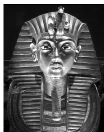
Золотая погребальная маска Тутанхамона (XIV в. до н. э.)

Богатейшим источником информации о культуре Египта стала гробница фараона Тутанхамона, обнаруженная в 1920-х годах Говардом Картером