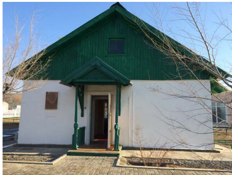
Домик Гагарина на второй площадке космодрома сохранили в том виде, в котором он был в 1961 году. Отсюда Юрий Алексеевич и его дублер Герман Степанович Титов уехали на старт

Сергей Павлович заходил в соседний домик несколько раз. Не расспрашивал ни о чем. Просто подтверждал, что подготовка к пуску идет по графику.