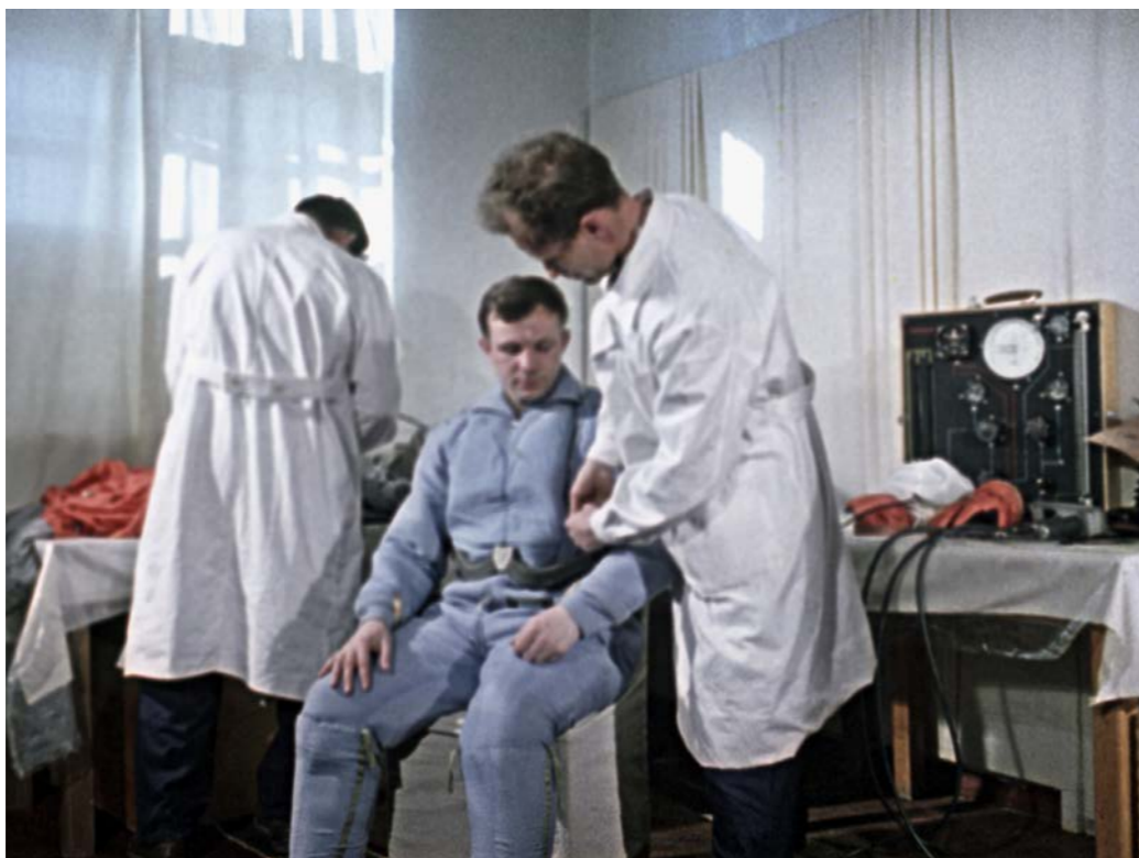
За несколько часов до полета... Синий комбинезон космонавты поддевали под скафандр

Королёв получил сообщение из Москвы, что старт американского астронавта назначен на 21 апреля.