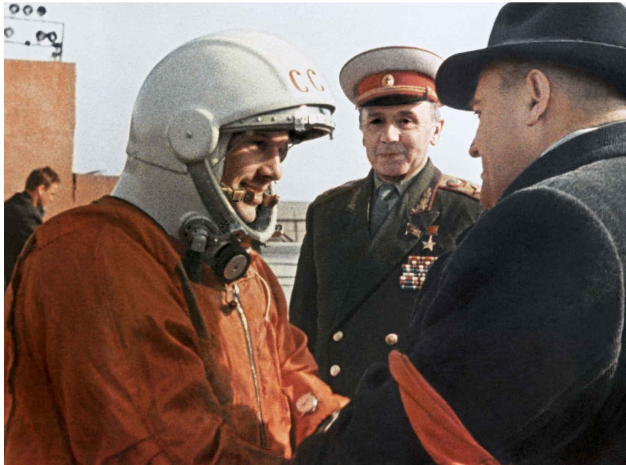
Перед посадкой в корабль. Справа — главный конструктор Сергей Павлович Королёв

Таким образом, этап подготовки корабля-спутника «Восток» для полета человека в космическое пространство завершен. Полученные результаты позволяют осуществить первый полет человека в космическое пространство по отработанной программе».