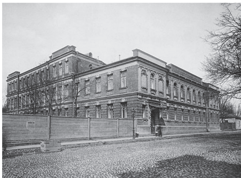
Московский областной клинический институт (МОКИ) (бывший Родильный дом имени Морозовых при Старо-Екатерининской больнице). Москва, 3-я Мещанская улица. 1913 год