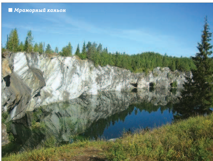
■ Мраморный каньон