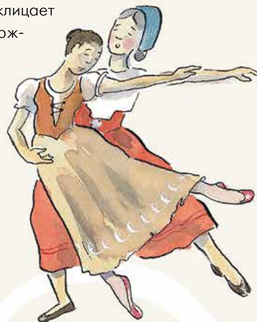
Композиция № 3

В деревню приезжает группа дворян. Жизель вместе с матерью приветствует высоких гостей, поражаясь их прекрасным нарядам и роскошным украшениям. Девушка танцует для них, а после их ухода рассказывает о них Лойсу. Как раз в этот момент появляется Ганс, разгадавший секрет юноши, и демонстрирует найденный им серебряный меч, на рукояти которого изображен тот же герб, что и на забытом дворянами рожке. «Он не крестьянин!» – восклицает лесник, в подтверждение своих слов трубя в рог.