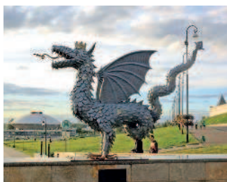
Крылатый змей Зилант — символ Казани