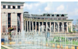
Площадь фонтанов перед театром Камала

Если вы держите в руках эту книгу, то, скорее всего, вы еще не бывали в третьей столице России. Но, вероятно, вы планируете визит в этот тысячелетний и одновременно такой молодой город. Мы, составители книги, постарались передать на ее страницах всю красоту и энергетику города, пропитанного историей, легендами, молодостью и событиями мирового масштаба.