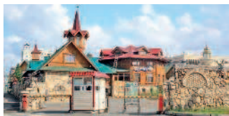
Татарская деревенька «Туган авылым» в центре города