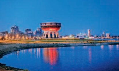
Панорама новых районов Казани