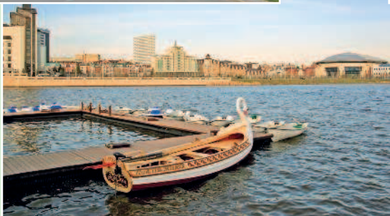
Прогулочные лодки ждут туристов на набережной озера Кабан