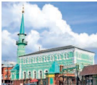
Одна из красивейших мечетей Казани — Султановская, основанная в 1868 году