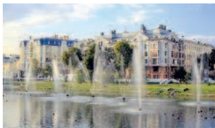
Парк Черное озеро

Несмотря на то что Казань в последнее время находится на виду и на слуху, для многих этот город становится настоящим открытием. Столицу Татарстана можно назвать городом сюрпризов, причем, что немаловажно, сюрпризов приятных. Кого-то удивляет экзотическое сочетание минаретов и колоколен, кто-то приходит в восторг от сабантуя, а других не оторвать от чак-чака и эчпочмака. Приезжайте в Казань, и вас наверняка очарует этот старинный город, на протяжении тысячелетия хранящий тайны и из поколения в поколение передающий свои легенды. А если захотите вернуться — просто бросьте монетку в озеро Кабан, воды которого много веков хранят несметные ханские сокровища. И желание загадать не забудьте — оно непременно исполнится. Надемся, мы сумели вас заинтересовать и вы непременно посетите этот волшебный, ароматный, шумный, спокойный, старинный и такой молодой город и еще не раз вернетесь сюда.