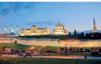
Белокаменный Казанский кремль прекрасен в любое время суток

Казань — один из самых юных и студенческих городов России: каждый третий ее житель моложе 30 лет, а каждый шестой житель является студентом.