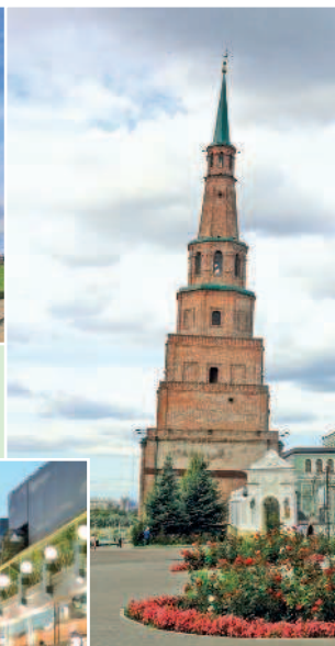
Падающая башня Сююмбике — один из символов Казани