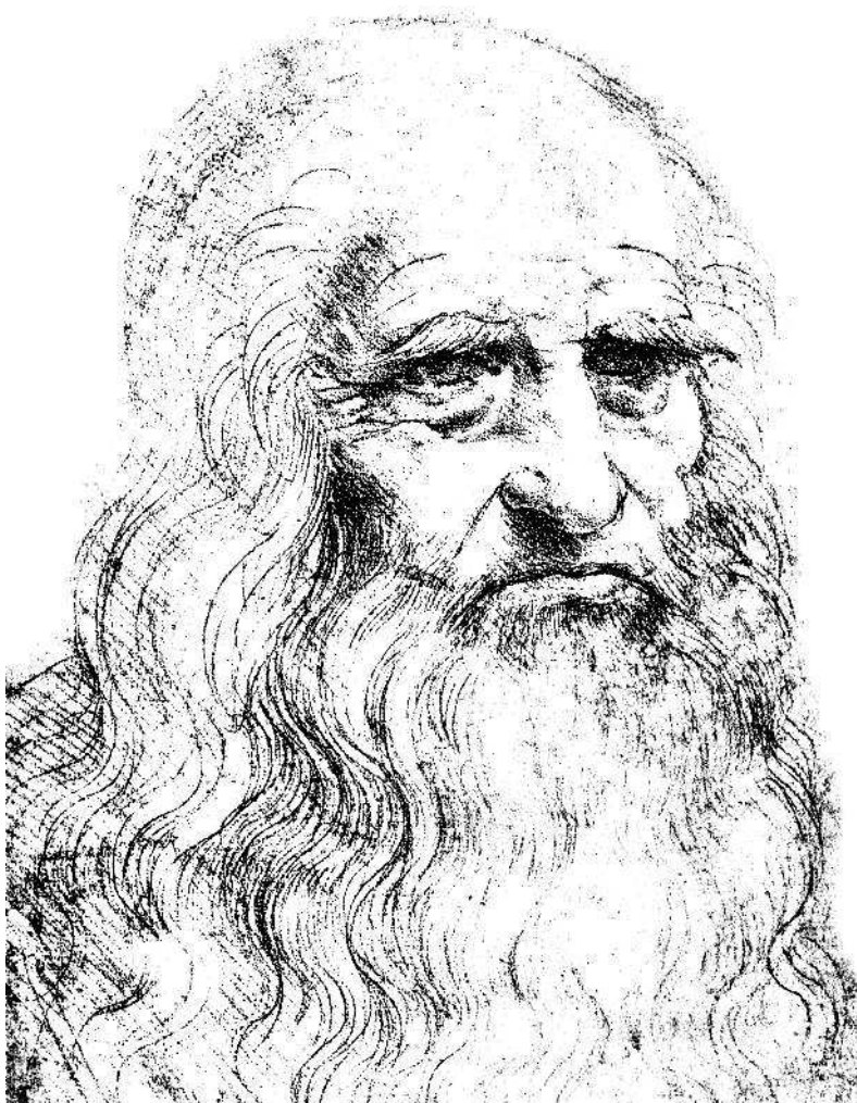
Леонардо да Винчи (1452–1519) Туринский автопортрет, после 1512 г.