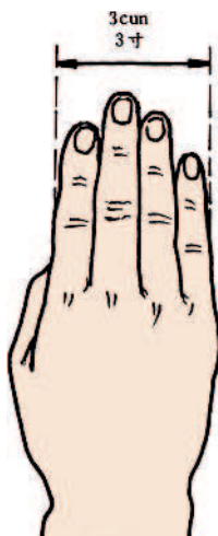
Измерения с использованием четырех пальцев — 3 цуня