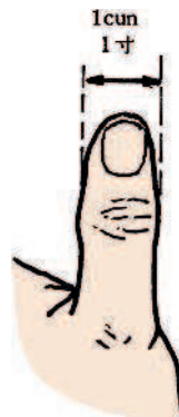
Измерения с использованием большого пальца — 1 цунь