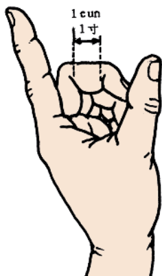
Измерения с использованием среднего пальца — 1 цунь