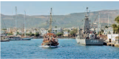
Остров Кос. Гавань