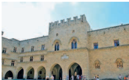
Дворец Великого магистра

Вечер. Подкрепившись, вечером продолжите прогулку по освещенным средневековым улочкам Старого города. Прогуляйтесь по здешним лавкам традиционных греческих продуктов и бутикам кожаных изделий.