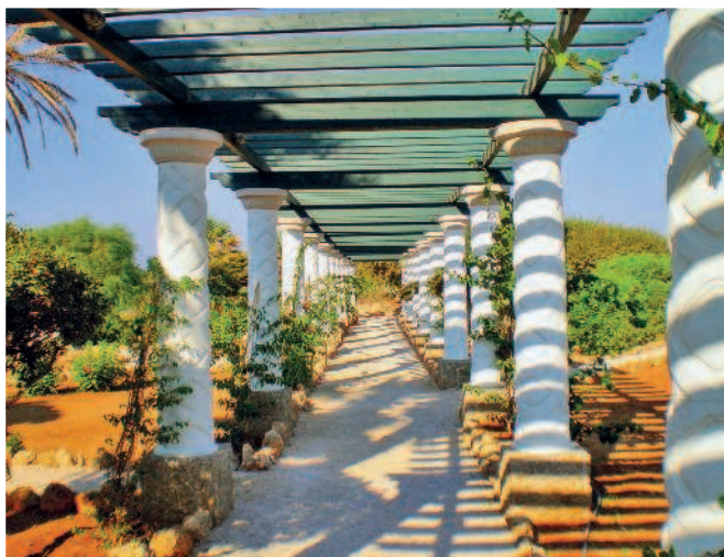
Дорога к термам на курорте Калифея