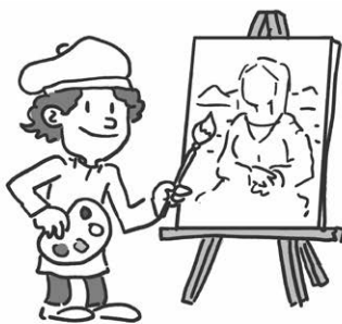
МАТЕО С. КЛАССНО РИСУЕТ.