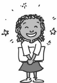
ГЭББИ М. СТАРОСТА КЛАССА.