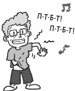
СВЕН П. УМЕЕТ ИЗДАВАТЬ ЗВУКИ ПОДМЫШКОЙ.

Ну а я? Достаточно сказать, что директриса знает меня по имени и я бывал в её кабинете чаще, чем полагается моим сверстникам.