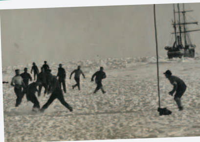
Футбольный матч в ледяной Антарктике (1914 год).

Антарктика Первый футбольный матч был сыгран в Антарктике в 1914 году во время экспедиции под руководством исследователя Эрнеста Шеклтона.