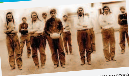
Команда индейского народа сиу готова выйти на поле (примерно 1910 год).

У коренных американцев была популярна игра пасукаукоховог, что переводится как «они собираются вместе, чтобы поиграть в мяч ногами». Число игроков в каждой команде доходило до 500. Травмы были распространенным явлением.