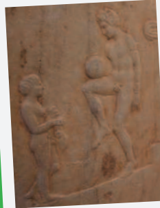
Древнегреческий игрок демонстрирует свое мастерство.

Центральная и Южная Америка Древние народы, такие как ольмеки, инки и майя, играли в мяч на специально построенных каменных площадках. Считается, что проигравших приговаривали к смертной казни!