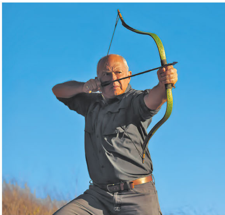
Автор в 2018 г.

Один из самых богатых аспектов изучения истории стрельбы из лука — то, что очень многое еще предстоит выяснить. Было исключительно интересно работать в архивах и отыскивать новые ценные крупы знаний, и, конечно, по-настоящему важны эмпирические данные. Факты часто нуждаются в интерпретации, что создает необходимость выдвижения гипотез и проведения экспериментов. Я стремился четко разграничить первые и вторые. Теории нуждаются в частой корректировке. Практические испытания постоянно проливают новый свет на многие вещи. Мы должны подвергать сомнению то, во что верим. Более всего мне хотелось бы, чтобы эта книга стала призывом к новым исследованиям. Столь многое еще предстоит узнать, я намечаю основные вехи.