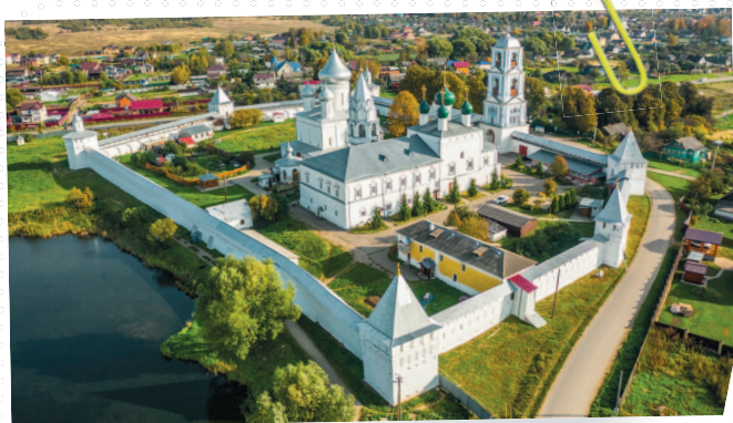
Никитский монастырь в Переславле-Залесском

заложены такие города, как Дубна, Переславль-Залесский, Юрьев-Польский, Дмитров, Кострома, Городец, Стародуб, Звенигород, Перемышль. Перенес Юрий столицу своего княжества из Ростова в Суздаль. Строил он и белокаменные церкви. До наших дней сохранились Борисоглебская церковь в Кидекше и Спасо-Преображенский собор в Переславле-Залесском.