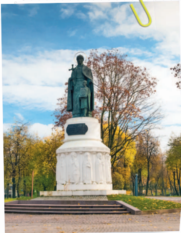
Памятник княгине Ольге Вячеслава Клыкова