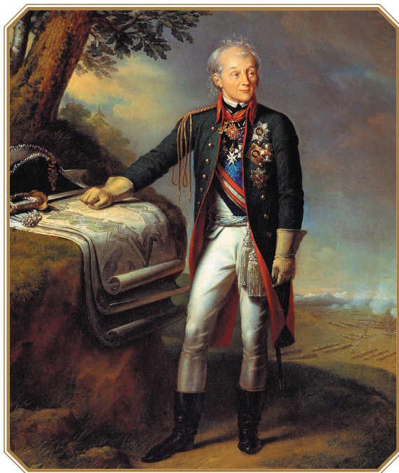
Карл Карлович Штейбен. Граф Рымникский, князь Италийский, генералиссимус А. В. Суворов. 1815 г.