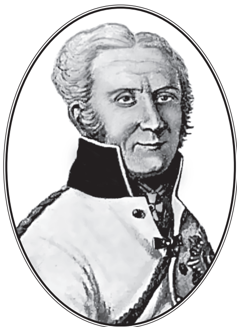
Роман Карлович Анреп-Эльмпт (1756—1807)

Российский генерал, находившийся в 1801 г. со своей дивизией на Ионических островах, откуда в 1805 г. переправился в Неаполь для совместных с неаполитанцами и англичанами действий против французов.