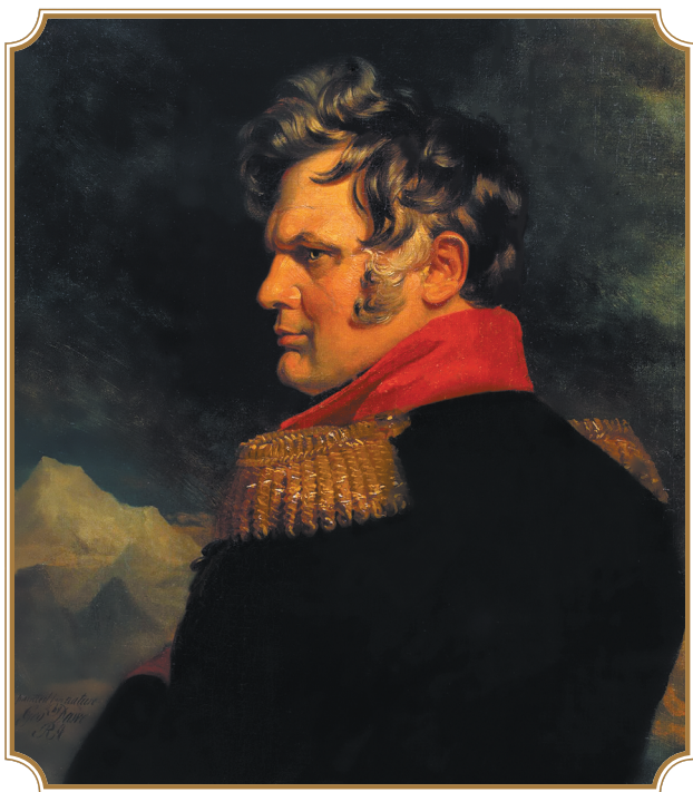
Дж. Доу. Портрет А. П. Ермолова. Не позднее 1825 г.