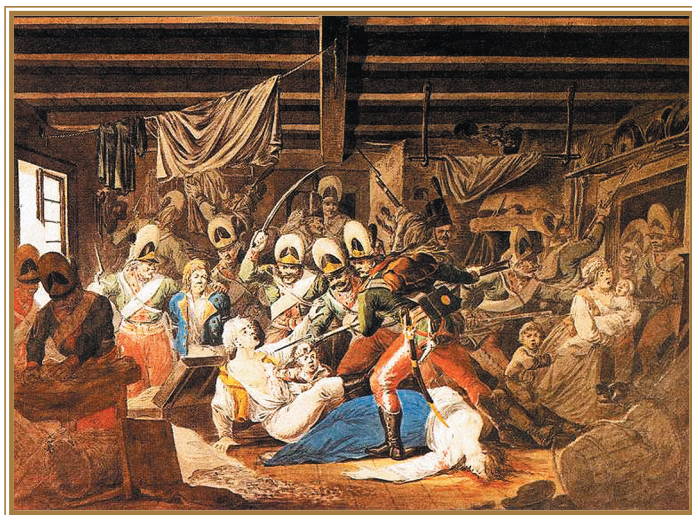
А. О. Орловский. Резня в Праге. 1810 г.