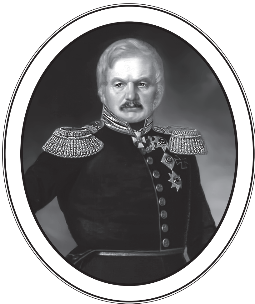
Алексей Петрович ЕРМОЛОВ