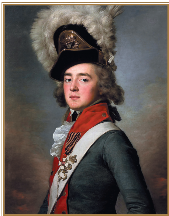
Жан Луи Вуаль. Портрет Валериана Зубова. 1792 г.