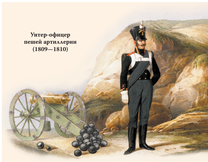
Унтер-офицер пешей артиллерии (1809—1810)