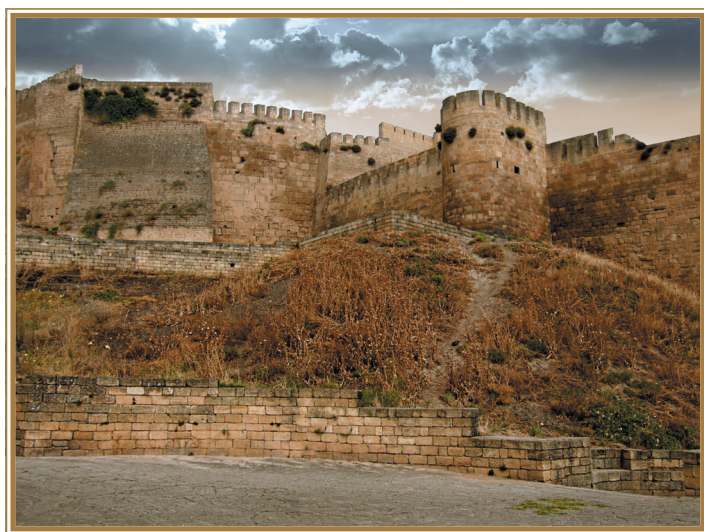
Крепость в Дербенте