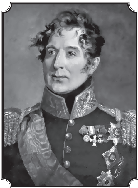
Михаил Андреевич Милорадович (1771—1825)

Военную карьеру Милорадович начал во время Русско-шведской войны 1788—1790 гг. и к 1796 г. стал капитаном.