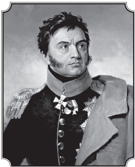
Николай Николаевич Раевский (1771—1829)

Генерал от кавалерии Раевский — прославленный герой войны 1812 г. (борьба за батарею Раевского — один из ключевых эпизодов Бородинского сражения), участник «битвы народов» и взятия Парижа. Член Государственного совета. Был близко знаком со многими декабристами. Дружбой с Раевским гордился А. С. Пушкин.