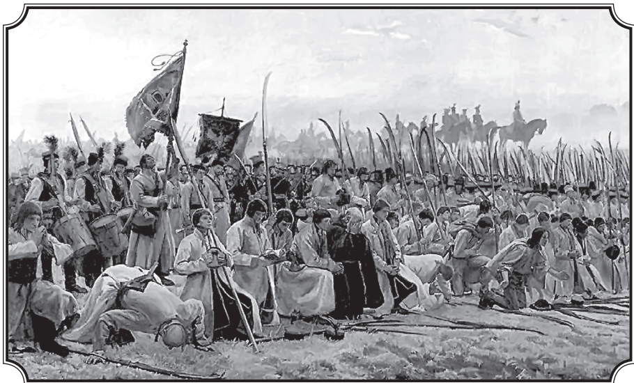
Иосиф Хельмонский. Восстание в Польше. Молитва перед битвой. 1906 г.

В 1794 г. на территории Речи Посполитой, включавшей в то время часть современных польских, белорусских, украинских и литовских земель, вспыхнуло восстание под предводительством Тадеуша Костюшко. Его участники, вдохновленные идеями Великой французской революции 1789—1794 гг., пытались противостоять исчезновению Речи Посполитой как самостоятельного государства.