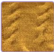
УЗОР 39 Страница 90