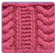
УЗОР 13 Страница 32