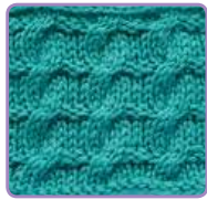
УЗОР 11 Страница 29