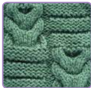
УЗОР 23 Страница 57