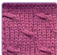
УЗОР 16 Страница 38