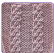
УЗОР 1 Страница 5