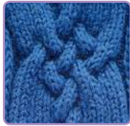
УЗОР 29 Страница 70