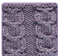
УЗОР 4 Страница 11