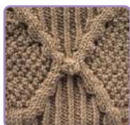
УЗОР 19 Страница 44