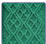
УЗОР 7 Страница 14