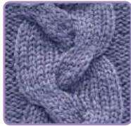
УЗОР 36 Страница 84