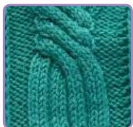
УЗОР 34 Страница 80