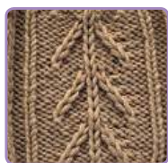
УЗОР 3 Страница 8