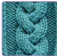
УЗОР 21 Страница 53