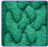
УЗОР 35 Страница 82