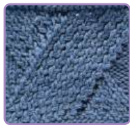
УЗОР 8 Страница 18