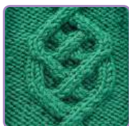
УЗОР 17 Страница 40