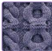
УЗОР 30 Страница 72