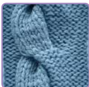
УЗОР 37 Страница 86