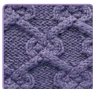
УЗОР 22 Страница 54