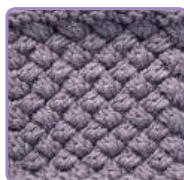
УЗОР 18 Страница 43