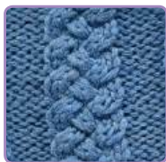
УЗОР 40 Страница 93