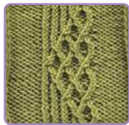
УЗОР 9 Страница 22