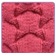
УЗОР 31 Страница 74