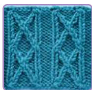
УЗОР 2 Страница 6