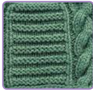
УЗОР 26 Страница 64