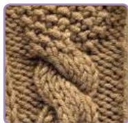
УЗОР 28 Страница 68