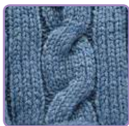
УЗОР 32 Страница 76