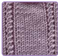
УЗОР 5 Страница 12