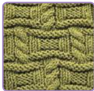
УЗОР 20 Страница 50