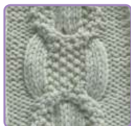
УЗОР 25 Страница 62