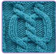
УЗОР 14 Страница 34