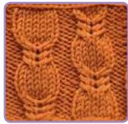
УЗОР 12 Страница 30