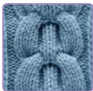
УЗОР 33 Страница 78