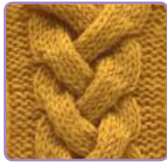
УЗОР 38 Страница 88