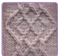
УЗОР 10 Страница 26