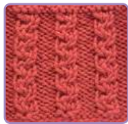
УЗОР 6 Страница 13