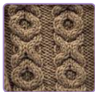
УЗОР 15 Страница 36