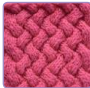
УЗОР 24 Страница 60