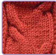
УЗОР 27 Страница 66