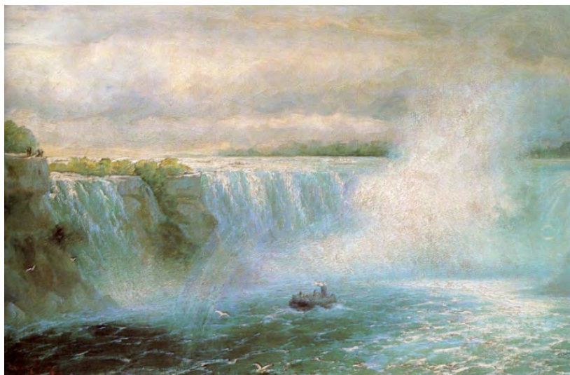
Иллюстрация 9. Ниагарский водопад. И. К. Айвазовский, 1893 г.