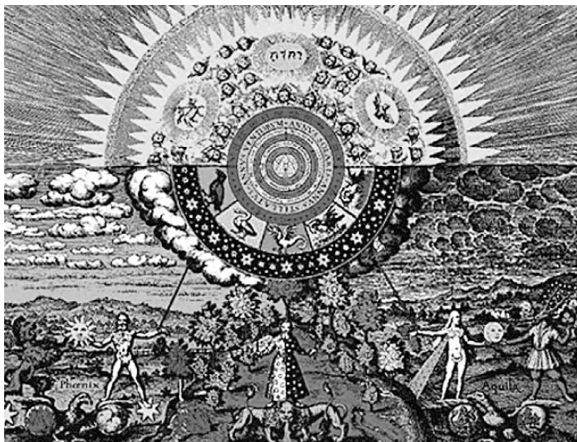
Изумрудная скрижаль. Макрокосм и микрокосм. Раскрашенная гравюра М. Мериана из книги «Basilica Philosophica», 1618 г.

планета, ведущая себя из ряда вон неподобающе (она, видите ли, решила лежать на боку), так и в астрологии она связана с нестандартностью, странностью и так далее.