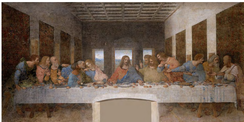
Иллюстрация 6. Тайная вечеря. Леонардо да Винчи, 1495–1498 гг.