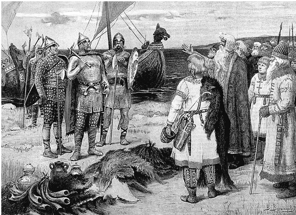
В.М. Васнецов. Варяги

В то время, когда южные славянские племена платили дань козарам, северные не могли защищаться от норманнов, жителей Швеции, Норвегии и Дании, которых славяне называли варягами и русью. Эти варяги покорили себе славян северных, живших в нынешних Новгородской и Псковской губерниях, покорили также соседние финские племена. Через несколько времени племена эти, как славянские, так и финские, собрались вместе и вы-