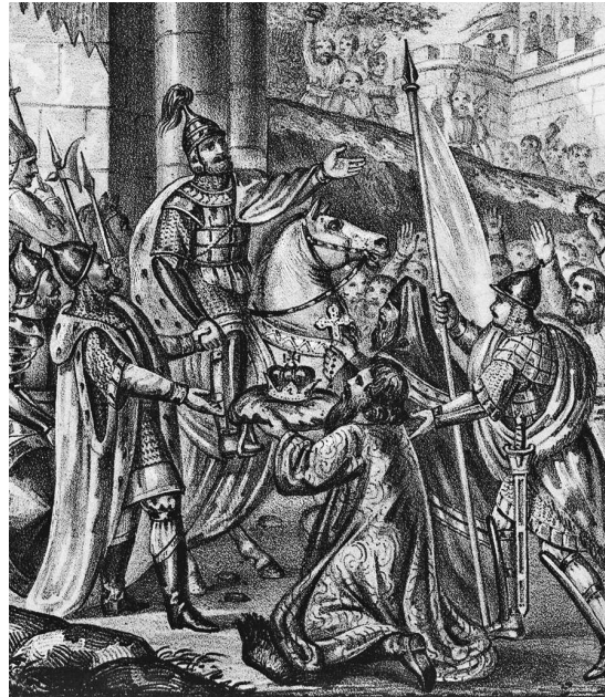
Б.А. Чориков. Изяслав принят братом Всеволодом, который предложил ему мир

Между тем в степях произошло обыкновенное там явление: пришел с востока новый хищный кочевой народ — половцы, победил печенегов и стал, подобно им, нападать на Русь. Великий князь Изяслав с братьями пошел против половцев, но был разбит и прибежал в Киев; киевляне потребовали у него оружия и лошадей, чтоб опять идти на половцев, но он им отказал; тогда они выгнали его. Изяслав получил помощь от польского короля Болеслава Смелого и занял опять Киев, но ненадолго: он поссорился с братом своим, Святославом черниговским, который вместе с тре-