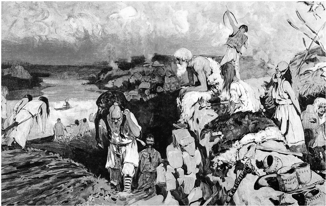
С.В. Иванов. Сцена из жизни восточных славян

Так как славянские племена жили отдельными небольшими родами, разбросаны были на обширных пространствах и ссорились между собою, то были слабы, не могли действовать вместе, заодно, собирать вдруг все свои силы для отпора врагам; нападут враги на одно племя, другие ему не помогают, и каждое порознь подчиняется чужому народу. Так славянские племена, которые жили на юго-востоке, по Днепру, по рекам, в него впадающим с востока, и по Оке, должны были платить дань козарам, народу, жившему на Дону, Волге и в Крыму. Народ этот был смешан из разных племен; между козарами можно было