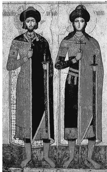
Борис и Глеб. Икона. XIV в.

После Владимира осталось двенадцать сыновей, и вот по смерти его начинаются усобицы, точно так же как начались они по смерти Святослава, точно так же как в это время велись они в других государствах славянских — Польском, Чешском (Богемском): и здесь видим желание старших князей изгнать, умертвить, изувечить младших братьев. Старший сын Владимира Святополк убил сначала самых младших братьев своих — Бориса, князя ростовского, и Глеба — муромского, которые казались ему опаснее других, потому что и отец их очень любил, и дружина по смерти Владимира звала Бориса княжить в Киев, но тот не согласился, не желая поднять рук на старшего брата. После Бориса и Глеба Святополк убил и третьего брата, Святослава, князя древлянского, и стал думать: «Перебью