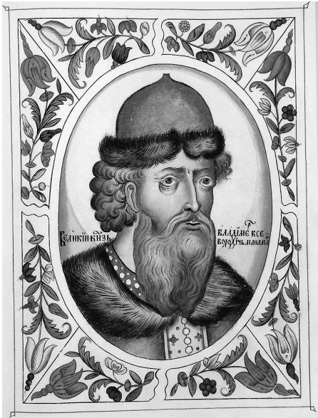
Великий князь Владимир Мономах. Портрет из Царского Титулярника. 1672

дяди Всеволода, как требовал обычай; другому Изяславу сыну, Ярополку, великий князь отдал Владимир Волынский, но здесь прежде княжил Игорь Ярославич, потом Ростислав Владимирович; сын Игоря Давид и сыновья Ростислава — Рюрик, Володарь и Василько — также хотели утвердиться на Волыни; по этой причине княжение Всеволода, старика слабого, было очень беспокойно. Но у Всеволода был сын, знаменитый Владимир Мономах, лучший из князей Древней Руси, оставивший по себе самую добрую память в народе как образец князя, по тогдашним понятиям: он был набожен, каждый день вставал до света и ходил к обедне, не мог молиться без слез, был гостеприимен, щедр к дружине, к духовенству, к бедным, но вместе с тем был хороший хозяин, сам смотрел за всем в доме и потому, несмотря на щедрость, в доме его всегда было