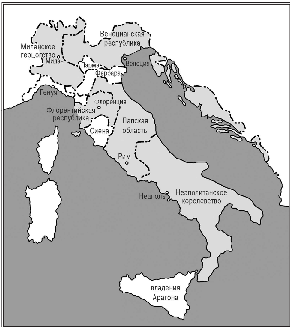
Границы итальянских государств в период существования Итальянской лиги (1454—1492 гг.)

учение классиков, но жажда привычной деятельности не покидала его. Он ищет возможности возвратиться во Флоренцию и снова поступить на службу. План этот казался ему осуществимым: многие из его прежних товарищей, служивших прежде республике, сохранили свои места и при Медичи, которые в общем управляли мягко, не прибегая к крутым переменам. Потребность служить государству побеждала в Макиавелли всякие иные соображения. Но все его искания долго оставались безуспешными. Только под конец своей жизни ему пришлось еще выполнить по просьбе Медичи несколько поручений, впрочем неважных. Но этот невольный покой, которым так тяготился Макиавелли, дал ему возможность предаться литературным занятиям и написать те произведения, которые обессмертили его имя. Поселившись в деревне, он вскоре принялся за свои политические трактаты. Позже он написал «Историю Флоренции» и несколько менее значительных произведений в прозе и стихах.