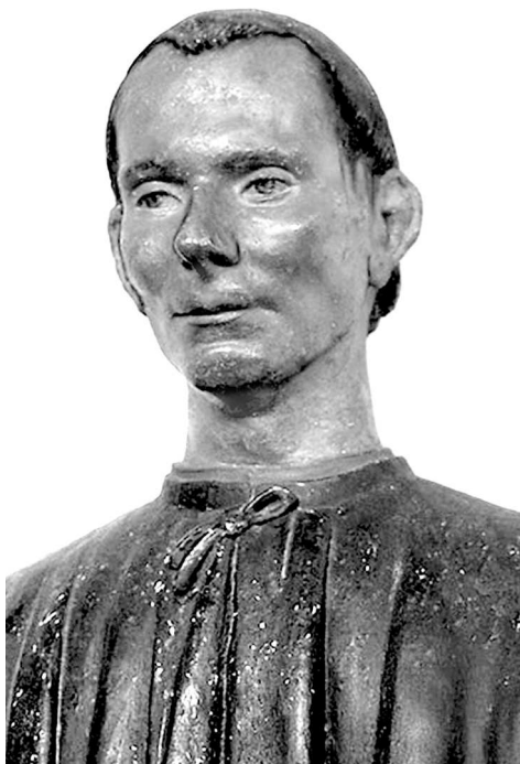
Деревянный бюст Макиавелли. XVI в.

мы видим будущего пронизательного мыслителя и тонкого аналитика. Вместе с тем перед нами раскрывается тот подготовительный процесс, которым воспитывалась политическая мысль Макиавелли.