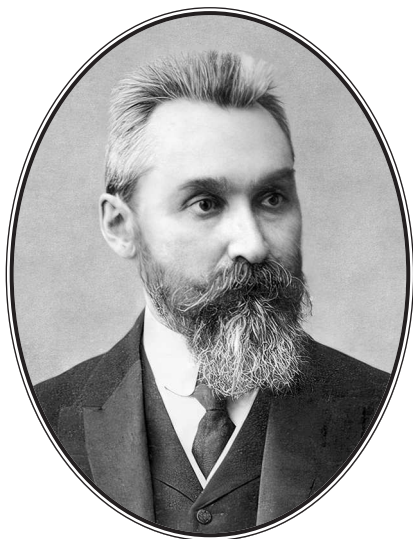
Павел Иванович Новгородцев (1866—1924)

Знаменитый русский юрист-правовед, философ, общественный и политический деятель, историк, автор книг по истории философии права.