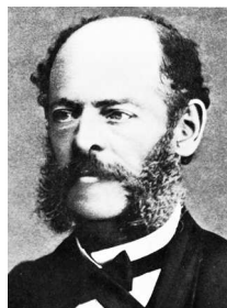
Марселино Санс де Саутуола

Сейчас мало кто сомневается в том, что первые люди умели рисовать.