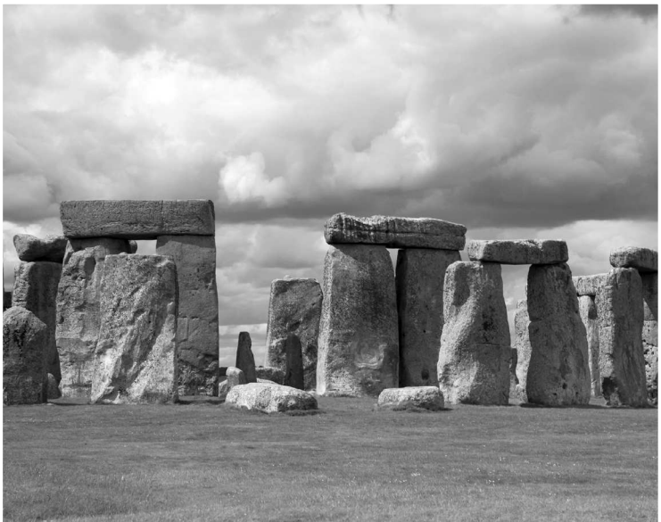
Кромлех Стоунхендж. Англия. Эпоха бронзы